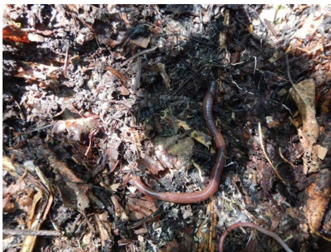
Figure 2. Exemple de débris ligneux sous lesquels les vers de terre ont été observés le long de sentiers pédestres de l'île aux Basques.