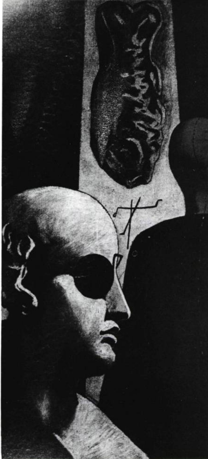
Giorgio de Chirico: Le songe du poète, 1914

«Bien penser le réel, c'est profiter de ses ambiguïtés pour modifier et alerter la pensée. Dialectiser la pensée, c'est augmenter la garantie de créer scientifiquement des phénomènes complets, de régénérer toutes les variables dégénérées ou éteintes que la science comme la pensée naïve, aurait négligées dans sa première étude.»