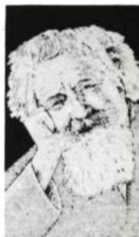
Bachelard par Alain Dufourq

Dans L'eau et les rêves , plus particulièrement, Bachelard définit l'esprit de l'eau en termes de métamorphose. L'eau est l'élément de la transition, de la mort quotidienne. «L'être voué à l'eau est un être de vertige.» 3 De songe en mélancolie, l'esprit de l'eau vogue sur le reflet du monde avec, à son bord, un léger vague à l'âme.