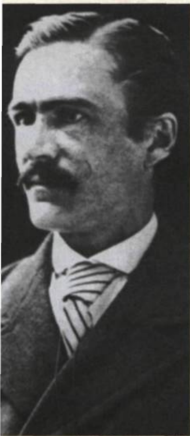
Joseph Marmette vers 1870