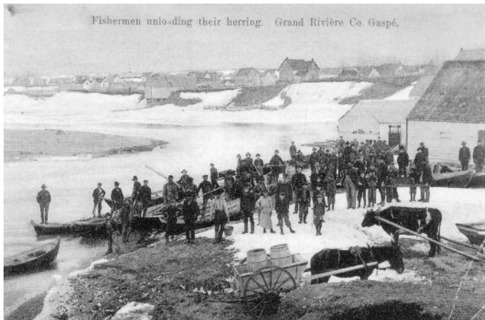
Pêcheurs de harengs à Grande-Rivière, Gaspésie, p. 94