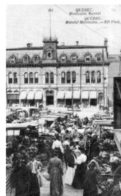
Marché Montcalm à Québec, p. 6