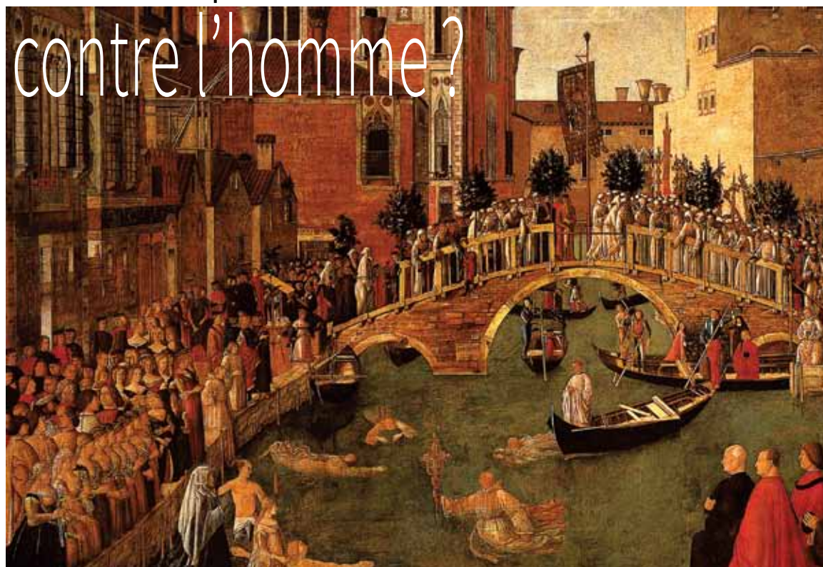
Miracle de la Croix au pont de San Lorenzo (Gentile Bellini, vers 1500).