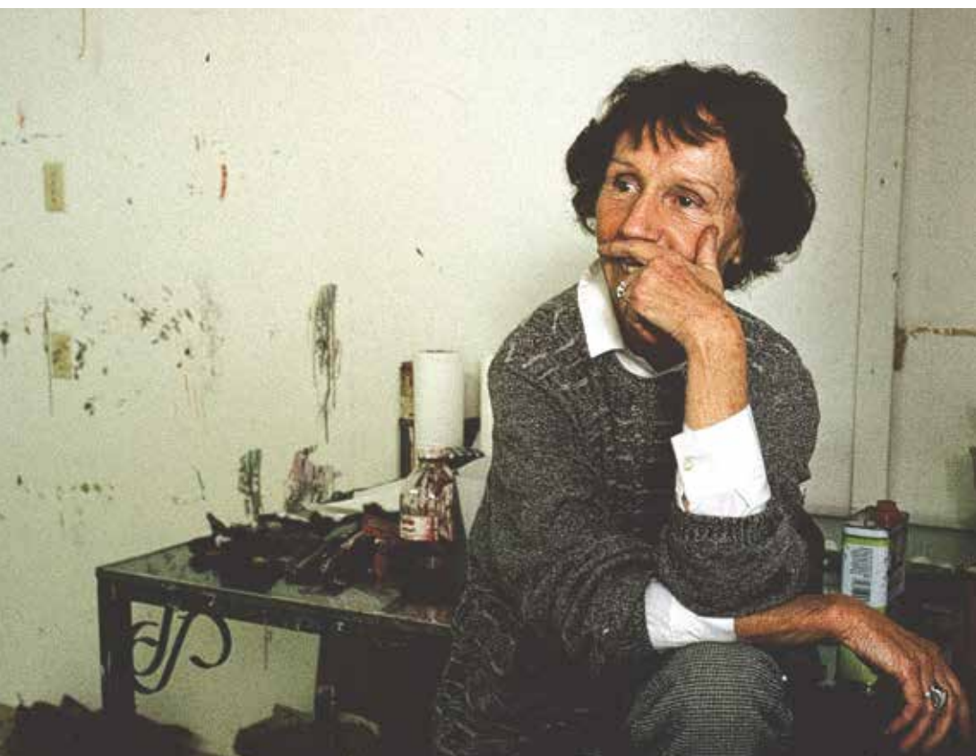
Marcelle Ferron dans son atelier d'Outremont