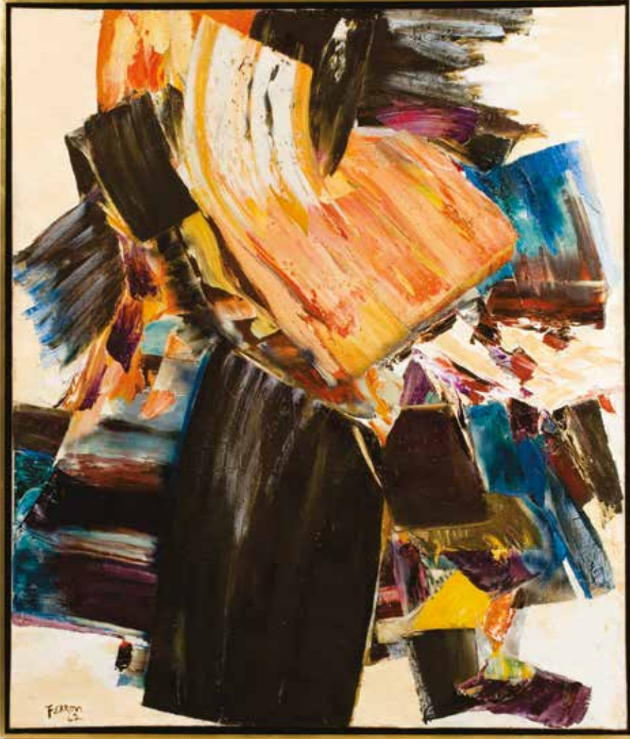
Marcelle Ferron, Kanaka , 1962. Huile sur toile, 201,5 x 171 cm. Musée national des beaux-arts du Québec, achat (1971.74).

L'œuvre de Marcelle Ferron est présentée dans le pavillon Pierre Lassonde du Musée national des beaux-arts du Québec, dans l'exposition De Ferron à BGL. Art contemporain du Québec .