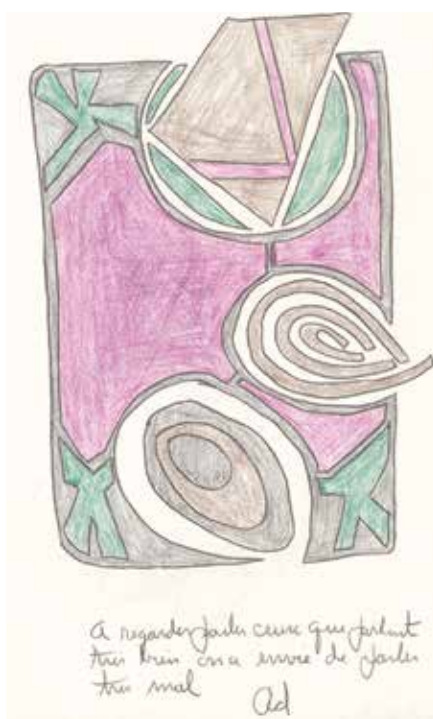
À regarder parler ceux qui parlent très bien on a envie de parler très mal p. 31

Nous connaissons déjà des collages qui avaient été exposés. Ici les dessins jaillissent d'abondance par l'emploi exclusif de crayons de couleur. Notre étonnement est immédiat, qui vaudrait aussi pour la lecture de ses livres : « Où