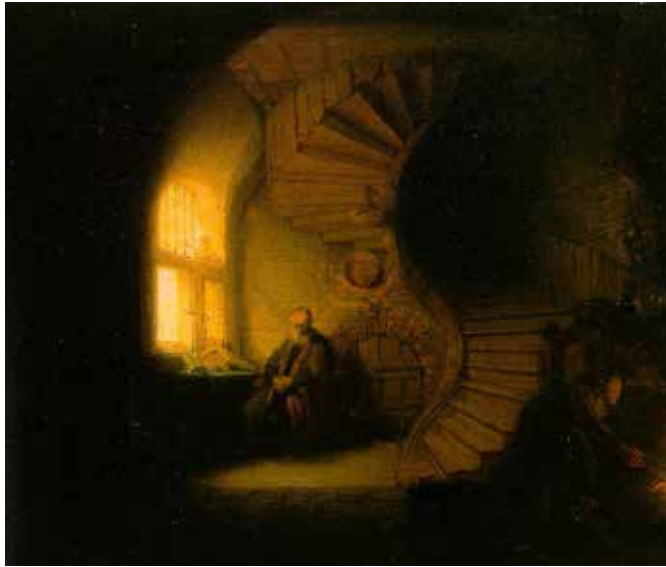
Philosophe en méditation de Rembrandt

Chez ces penseurs-phares, Onfray n'hésite pas à circonscrire les zones d'ombre, les petites, voire les noirceurs. À l'occasion il dénonce les idées fausses entretenues par exemple sur Descartes (portrait d'après Frans Hals), ou les contresens sur l'interprétation de certaines toiles (ainsi le célèbre Philosophe en méditation de Rembrandt sous la cage d'escalier). Le lecteur qui anticipait inévitablement un long exposé sur Freud et sa démolition ne sera pas déçu ! La liste des « mensonges » freudiens est établie une nouvelle fois, répétant Le crépuscule d'une idole qu'Onfray lui a consacré. Le procès est rouvert mais l'accusé bénéficie de circonstances atténuantes ! On peut