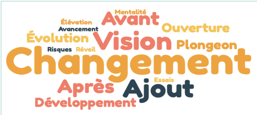
Figure 2. Termes utilisés par les enseignantes pour illustrer les transformations liées au rapport à la littérature

Dans cet extrait, Diane fait un lien direct entre son rapport à la littérature et son enseignement. Les mots utilisés par les enseignantes pour décrire les changements, voire la bonification de leurs pratiques, sont illustrés, en termes de fréquence, à l'aide d'un nuage de mots à la figure suivante.