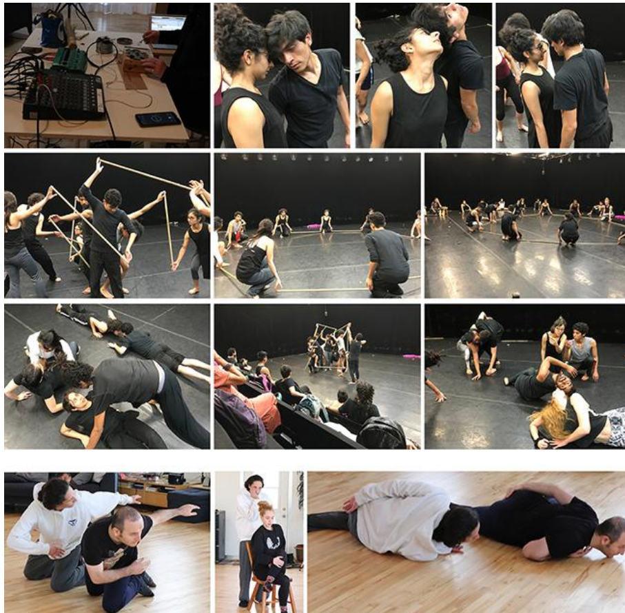
Ateliers de recherche-cr ation. Universit  du Qu bec   Montr al, Montr al (Canada), novembre-d cembre 2019. Festival Internacional de Teatro Universitario, Universidad Nacional Aut noma de M xico (Mexique), f vrier 2020.

Photographie de Varnen Pareanan et V ronique H bert