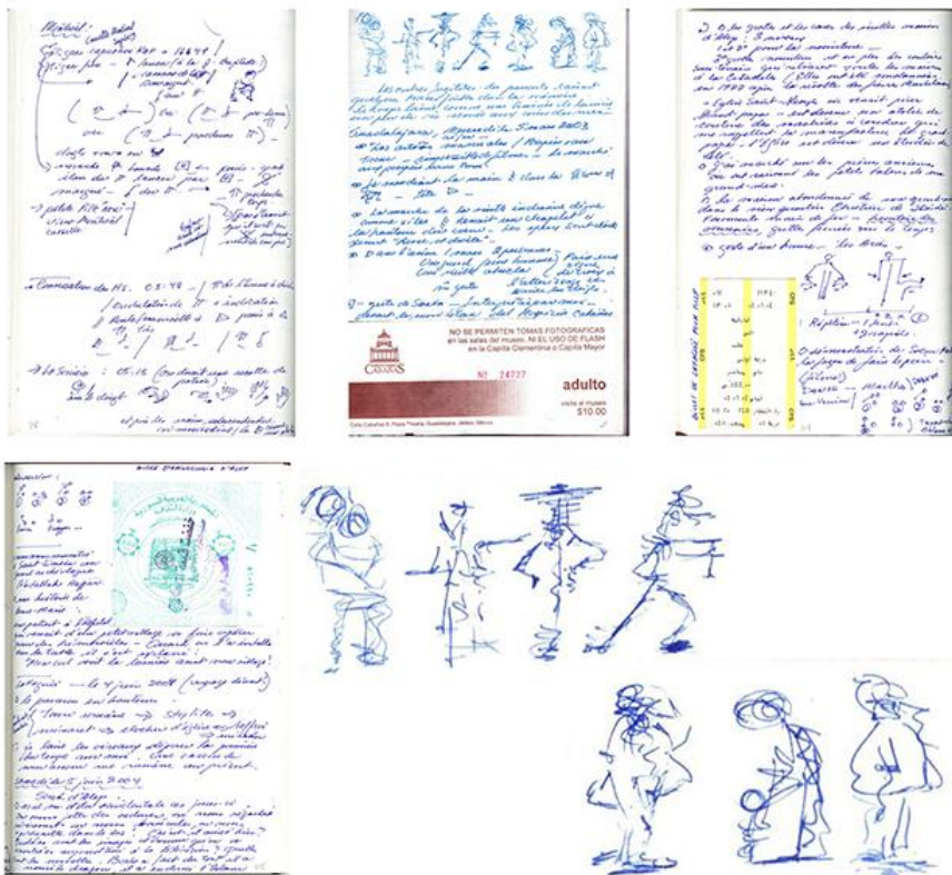
Pages du journal remplies de motifs, de gestes, de réflexions.

Archives personnelles pour le processus de création de La glaneuse de gestes .