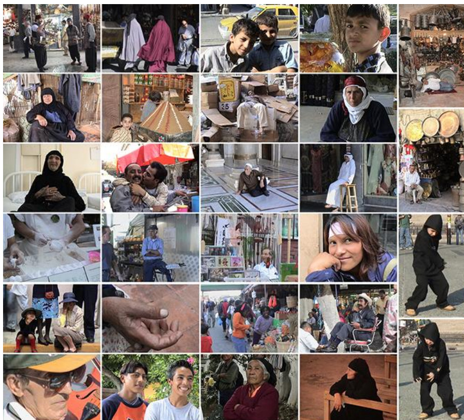
Mosaïque de photographies prises lors de mes observations dans les souks et les rues d'Alep, du Mexique et de Montréal.

Archives personnelles pour le processus de création de La glaneuse de gestes .