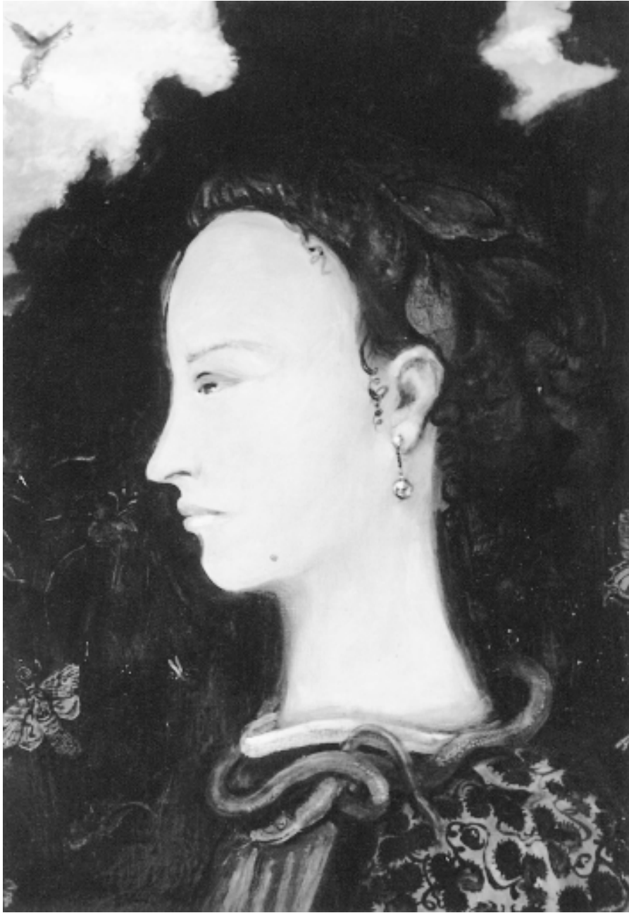
La Caduta di Lucifero: «Andromaque». Peinture à l'huile sur toile, 2 x 3,05m. 1995. Collection du Musée du Québec.