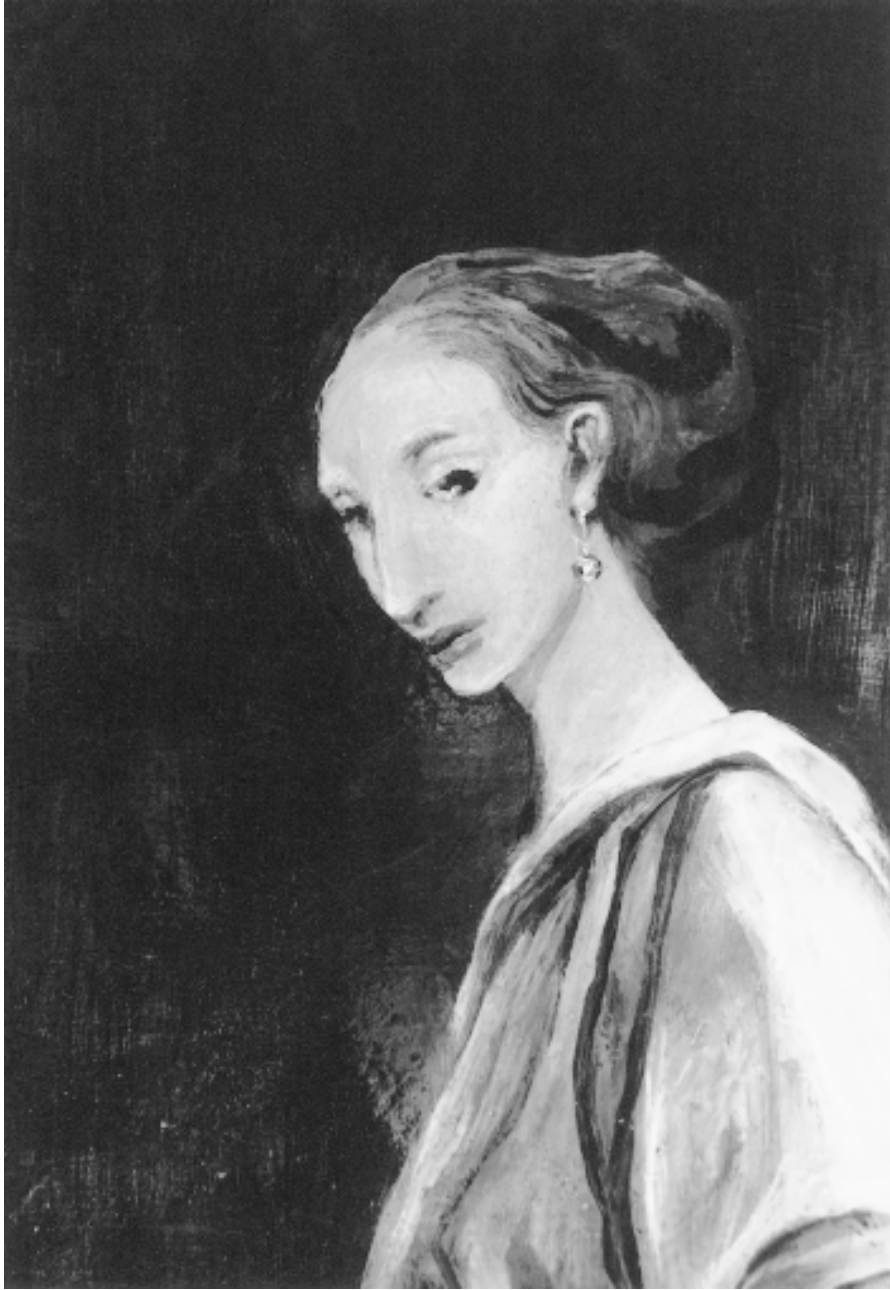
La Caduta di Lucifero: « Laurie Walker ». Peinture à l'huile sur toile, 110 x 80 cm, 1994.