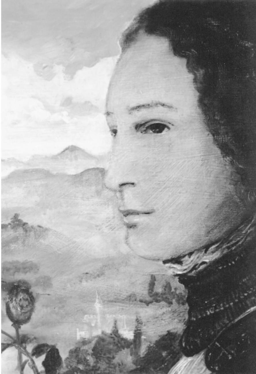
La Caduta di Lucifero: « Homme » . Peinture à l'huile sur toile, 184 x 120cm, 1994.