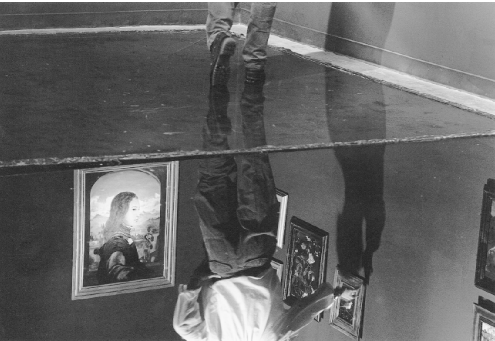
La Caduta di Lucifero . Installation à la Galerie Christiane Chassay (Montréal) et au Mercer Union (Toronto, Ontario) : 65 m 2 , 1995.