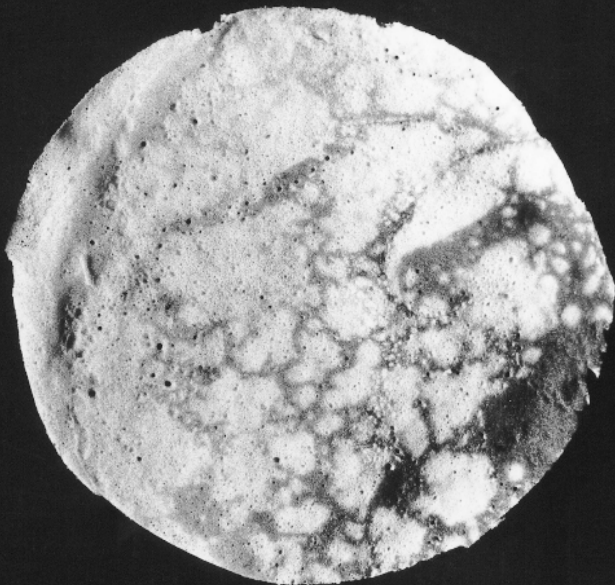
Areoarcheologic : Archéologie sur planète Mars. Installation : échafaudages, aquariums, brique concassée, systèmes électriques. Galerie Koffler, Toronto (Ontario), 1997. Image : Crêpes de 23 cm de diamètre. Photo de l'artiste.