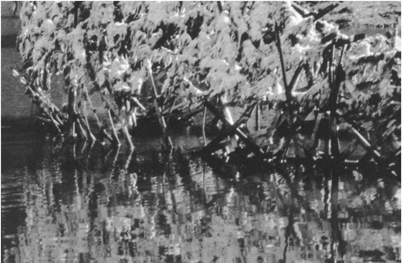
Détail, 1999. Recherche photographique/reflets, transformation des éléments du site et des matériaux. Installation à la citadelle de Brouage, France.