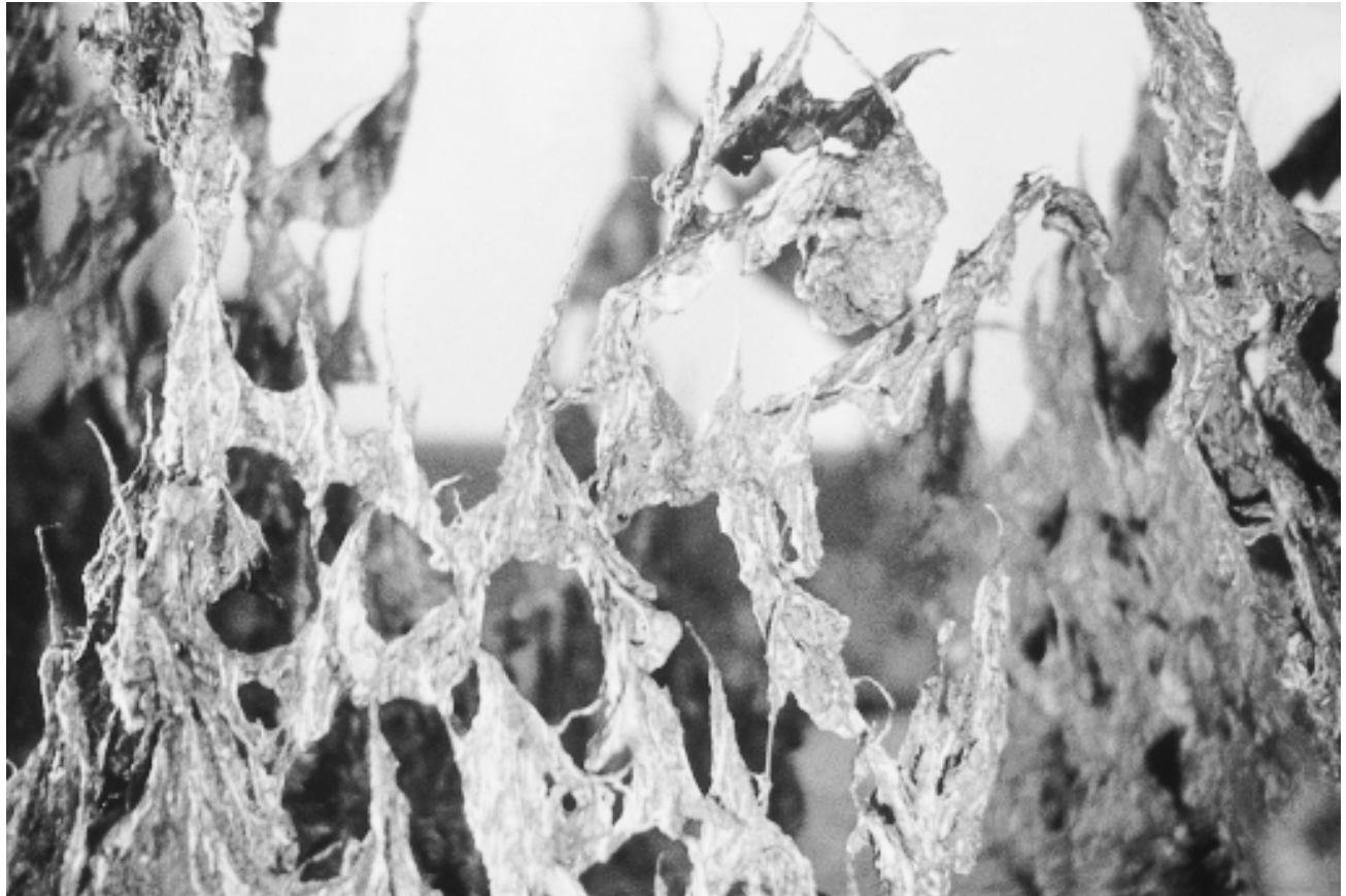
Topologies, 5m x 7m (surface) et 20cm à 1,20m (hauteur), 1996. Structures de cuivre et de fils d'acier recuit, trempées dans la pâte de denim broyée. Éclairage : néon flexible et lampes de poche. Centre national d'exposition de Jonquières.