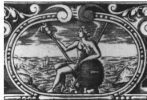
Ill. 2 : William Camden, 1607, British Library.

impérial de Rome établi en Angleterre, plutôt qu'une déité locale. Britannia ne devient vraiment un symbole national qu'à partir du XVII e siècle, au moment où les ambitions impériales britanniques commencent à se développer au point que, deux siècles plus tard, elles rivaliseront avec celles de la Rome antique.