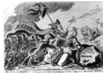
Ill. 10 : George Cruikshank (1792-1878) : DEATH or LIBERTY! Or Britannia and the Virtues of the Constitution in danger of Violation from the great Political Libertine, Radical reform! , 1819.

Dans l'image caricaturale de James Gillray (ill. 9), deux rivaux politiques, Lord North et Charles James Fox (celui-ci identifié dans l'image par sa tête de renard), se réunissent pour fonder une coalition (en l'occurrence de courte durée) et ainsi établir une base plus solide au gouvernement de la Grande-Bretagne. Pour humaniser la figure allégorique de Britannia, la transformer en femme vivante et vulnérable, Gillray lui enlève la plupart de ses attributs symboliques (casque, trident, char, coursiers) pour la laisser ramper à quatre pattes. Son bouclier fêlé est abandonné et son trident, transformé en simple lance, ne sert que d'appui, à l'exemple d'une simple canne. Quoiqu'elle garde les restes de sa cuirasse, elle porte les souliers à hauts talons d'une courtisane, plutôt que les sandales d'une déesse, et sa robe simple n'offre aucune protection contre les attaques de ses ennemis. Ceux-ci sont en effet ses amis et protecteurs, les «administrations», dans le double sens politique et médical, de ses faux docteurs («Quacks»), prenant la forme d'un lavement. L'effet à la fois choquant et comique – et donc à