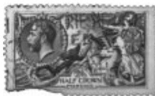
Ill. 5 : Bertram Mackennal, timbre-poste Georges V, 1913-1936.

dire nautiques (trident, hippocampes, char, flots, côte rocheuse). À partir du XIX e siècle, l'image de Britannia se caractérise ainsi :