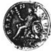
Ill. 1 : pièce de monnaie romaine, 1 er siècle de notre ère, British Museum.

Certes, l'image de Britannia remonte à l'époque romaine, où elle apparaît sur la monnaie utilisée dans la colonie qu'était encore l'Angleterre au premier siècle de notre ère (ill. 1). Mais la Britannia représentée sur ces pièces anciennes était le symbole du pouvoir