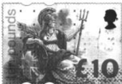
Ill. 7: B. Craddock, timbre définitif à haute valeur (£10), 1993.

des objets extérieurs à l'icône elle-même, mais qui sont néanmoins susceptibles de la renforcer (par exemple, la flotte anglaise qui est parfois associée à l'image de Britannia, ill. 3 ). Dans des représentations officielles de l'icône nationale, c'est surtout la dynamique centripète qui domine: quand l'icône est utilisée dans des contextes plus ouverts – humoristique ou satirique –, c'est la dynamique centrifuge qui prime, élargissant les attributs de l'icône pour qu'elle puisse embrasser des connotations ou des situations au-delà de sa fonction normale ou officielle. C'est ici qu'entrent en jeu, dans le mécanisme sémiotique de l'icône nationale, les potentialités narratives ou mythiques associées à l'allégorie. Car dans chaque nouveau contexte, historique ou mythique, l'icône nationale doit être à même d'agir ou de jouer un rôle qui à la fois élargit et consolide ses attributs intrinsèques.