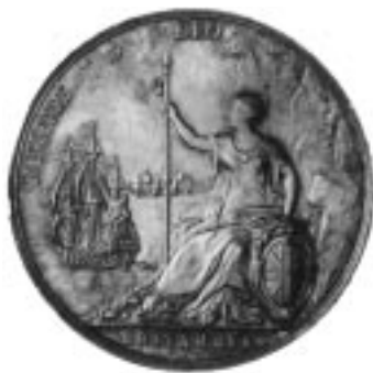
Ill. 3 : Médaille, 1667, British Museum.