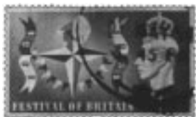
Ill. 6: Abram Games, timbre commémorant le Festival of Britain, 1951.