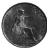
Ill. 4 : Pièce de monnaie, 1897.