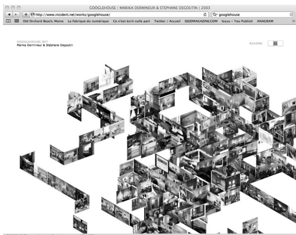
Googlehouse de M. Dermineur et S. Degoutin, 2003.

plan d'une habitation, fait uniquement de parois sur lesquelles sont exposées des images puisées à même le Web, via le moteur de recherche de Google. Neuf choix de pièces sont disponibles ( living room, bedroom, tv room, dining room, bathroom, etc. ), mais nous pouvons faire notre propre choix, et meubler ainsi notre maison d'images de Lady Gaga, de Bart Simpson, etc. La maison qui est proposée est inhabitable, c'est une architecture infinie, une maison-flux dont les parois ne cessent de défiler, mais elle nous renvoie l'image que nous avons choisie pour meubler notre imagination. Google n'est plus un simple moteur de recherche, nous dit Googlehouse, il est devenu symboliquement notre foyer, source de nos informations et lieu premier d'habitation virtuelle.