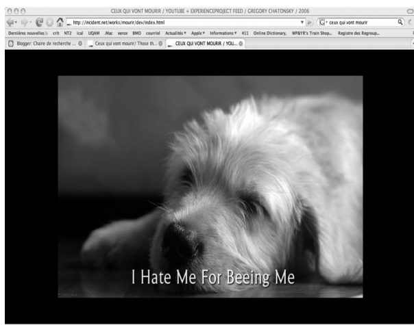
Ceux qui vont mourir de G. Chatonsky, 2006.

[...] de se placer résolument dans le flux, puisqu'on ne saurait être au dehors, en l'utilisant comme médium, c'est-à-dire comme langage. (2007 : 87)