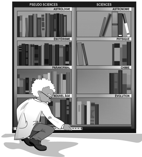
Figure 1. Procédure utilisée pour la collecte des données dans les librairies.

Au cours des étés 2001 et 2011, munis d'un ruban à mesurer, nous avons sillonné la province de Québec en vue d'évaluer l'espace en centimètres occupé par les ouvrages de sciences et de pseudosciences destinés aux adultes, et par la science et la spiritualité destinés aux enfants (voir Figure 1). Nous avons bien sûr obtenu toutes les autorisations nécessaires avant d'effectuer les mesures.