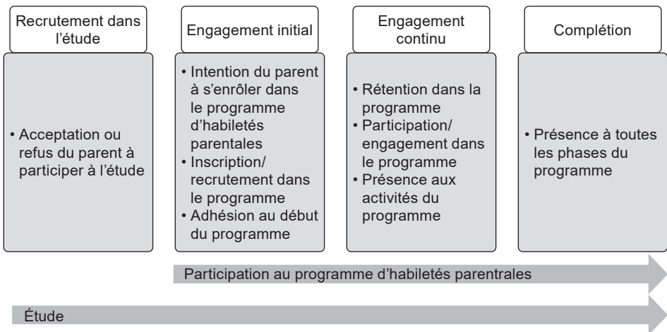
Figure 1. Modèle de participation parentale