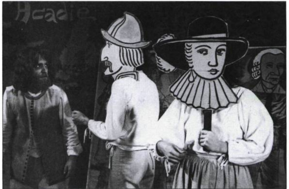
La Coopérative de théâtre l'Escaouette Ltée. « Histoire en histoire », d'Herménégilde Chiasson.

Depuis 1970, un coup d'œil rapide nous a permis de recenser une quarantaine de pièces originales de treize auteurs différents. Ce dénombrement exclut d'un côté l'œuvre d'Antonine Maillet, suffisamment connue pour que nous nous dispensions d'en rendre compte ici, et de l'autre côté, le théâtre amateur pratiqué dans les écoles dont les nombreuses manifestations, malgré ses maudresses, nous portent à croire en l'avenir du théâtre acadien. C'est là une moyenne annuelle plus que respectable, dans le domaine de la création théâtrale, compte tenu de la faible densité de la population, disséminée sur un territoire vaste et aux particularités régionales prononcées, compte tenu aussi de la précarité des moyens, du côté de la production.