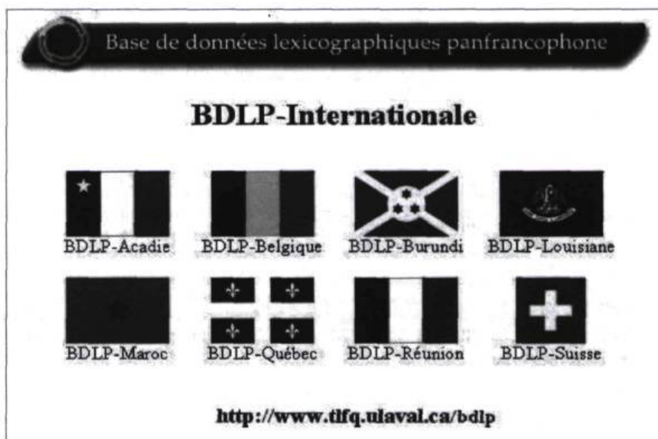
FIGURE 1 Pays ou régions représentés actuellement dans la BDLP

La BDLP a été ouverte à la consultation publique le 18 mars 2004, à l'occasion d'une cérémonie officielle qui s'est tenue au Musée de la civilisation, à Québec, sous la présidence de la rectrice de l'Agence universitaire de la Francophonie, madame Michèle