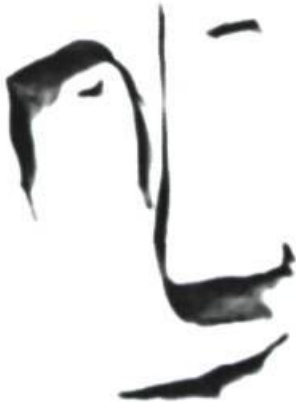
Illustration : www.milgour.ca/poems/le_banouchibouchouquegaston_miron.jpg