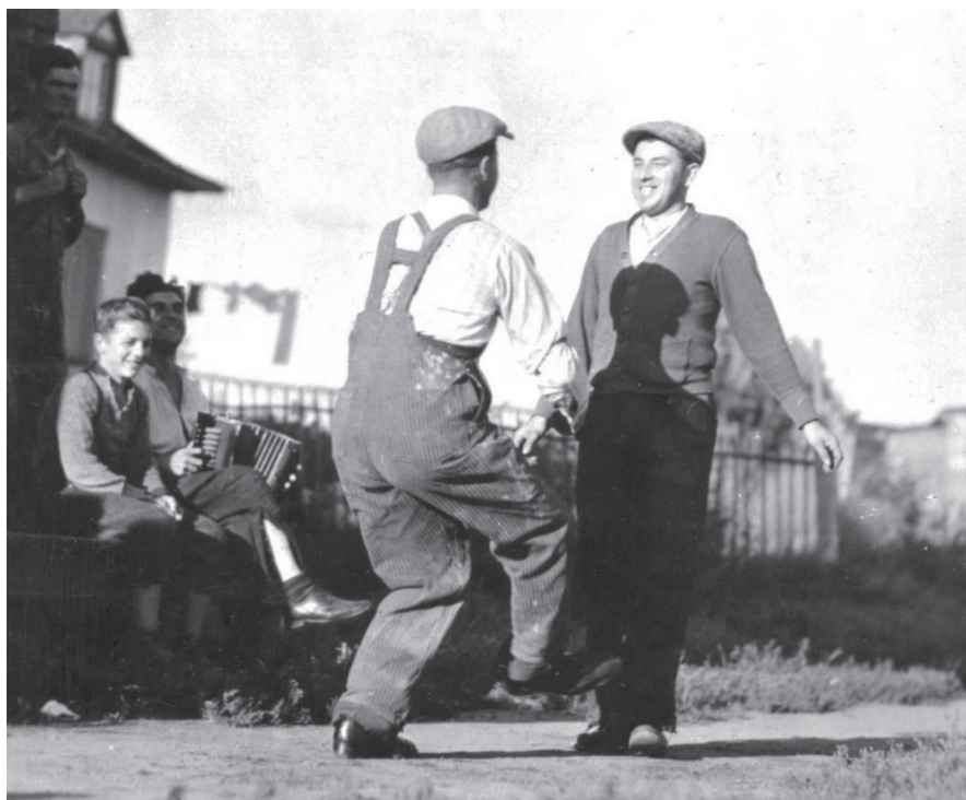
Danseurs près de Charlesbourg, Québec, 1941.