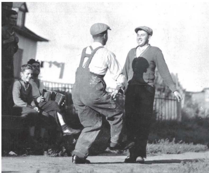
Danseurs près de Charlesbourg, Québec, 1941.