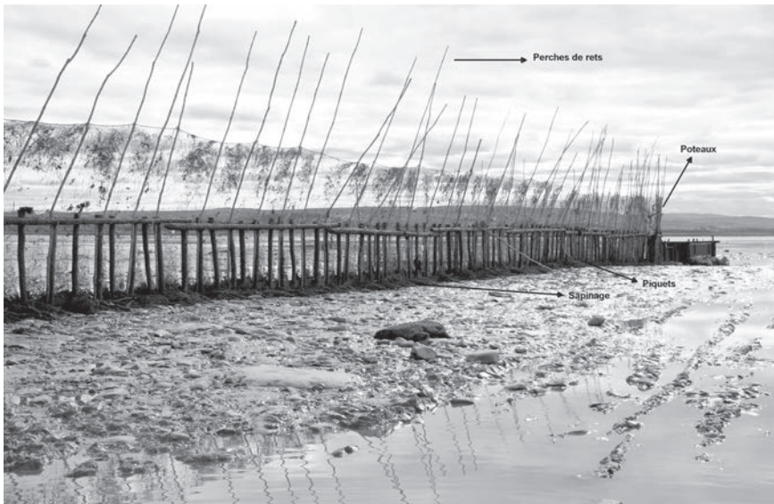
Pêche à filets fixes et identification des poteaux, piquets et perches de rets Rivière-Ouelle, 2016