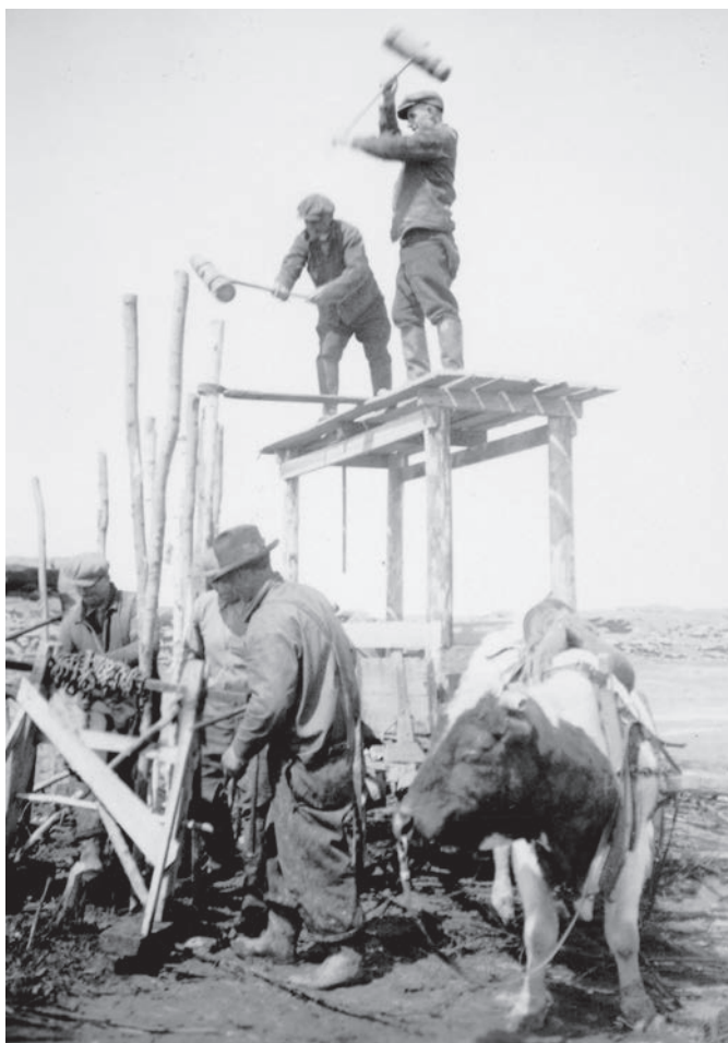
Construction d'une pêche à anguilles requérant deux masseurs et deux autres ouvriers à Saint-Denis-de-la-Bouteillerie, vers 1936