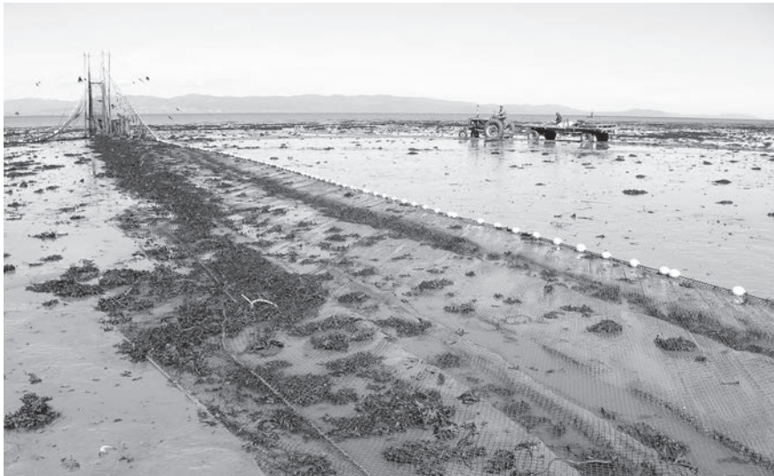
Pêche à filets flottants de Guy Dionne à Saint-André-de-Kamouraska, 2015

À la fin des années 1970, une nouvelle technique de pêche utilisée en Suède s'est implantée graduellement au Québec. À la suite d'un voyage d'études de représentants de l'Association des pêcheurs d'anguilles du Québec, les pêcheries à filets flottants sont de plus en plus utilisées. Comme le dit le nom, les filets au lieu d'être fixes flottent et ainsi suivent le niveau de l'eau selon les marées. Ils sont retenus au sol par de lourdes chaînes d'acier. Des poteaux d'environ 6 m de haut et requérant un haubannage s'ajoutent aux installations. Les filets flottants ne conviennent pas à tous les emplacements. Ils sont à éviter là où les algues, le sable et la vase peuvent les recouvrir en partie et les retenir au sol. Les pêcheurs rencontrés en 2016 utilisent pour la plupart les deux types de pêcheries, soit la traditionnelle à filets fixes et celles à filets flottants.