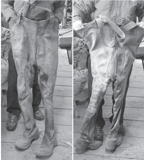
Devant et arrière d'une paire de bottes-culotte réalisée avec le cuir de l'arrière-train d'un cheval ; elles auraient été confectionnées vers 1900 et ont appartenu à trois générations de Labrecque : Désiré, Misaël et Rodrigue, pêcheurs à Saint-Michel-de-Bellechasse