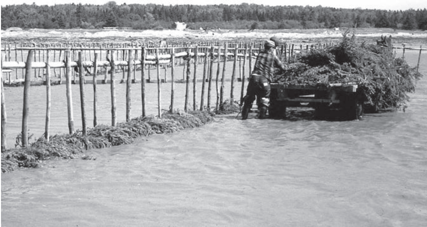
Émile Lizotte et son fils, Georges-Henri, déposent des branches de sapin au pied de leur pêche à fascines, Rivière-Ouelle, 1966

Le pêcheur utilise également de courtes branches d'épinette ou de sapin. Il les dépose au sol là où les ailes de sa pêche seront érigées. Leur rôle est de provoquer l'accumulation de boue et de sable nécessaire pour empêcher les anguilles de se frayer un chemin sous la pêche. Vient ensuite la taille des poteaux, des piquets et des perches de rets 17 qui formeront la structure. Une pêche à anguilles de taille moyenne requiert environ mille piquets de 2 m taillés dans de l'épinette noire. Les perches de rets atteignant les 3,5 m viennent s'ajouter à tous les deux piquets. Elles servent à rehausser la pêche. Elles sont en bois d'érable ou d'ostryer. Plusieurs piquets et perches cassent lors d'une saison de pêche dû aux intempéries. Georges-Henri Lizotte estime remplacer environ 300 perches de rets annuellement pour une utilisation totale de 500 par saison.