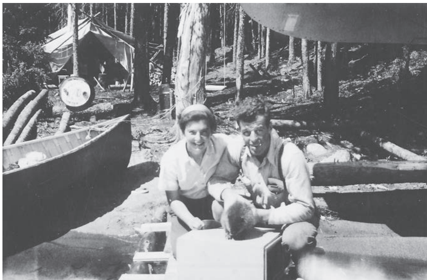
Au lac Opémiska, en 1952 lors d'un arrêt de l'équipe pendant le tournage du film sur les castors SHRC (P171)

en dessous du siège de droite, puis se faufila le long du mur (coupe-feu) entre le moteur et mes pédales du gouvernail de direction. J'avais les pieds sur les pédales et je n'osais bouger. Le castor a décidé de changer de place [...], il passa sous mon siège, sans s'arrêter heureusement ! Puis il retourna en arrière et, là, il a décidé de se mettre au travail et de gruger le bord d'une fenêtre. Pas besoin de vous dire que, rendu à destination, je lui ai donné la chance de sortir le premier. 19 » L'événement ne se reproduisit pas, car, par la suite, les poches de jutes furent remplacées par des cages de bois 20 !