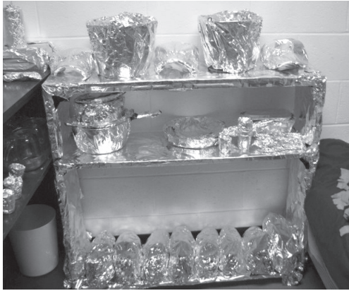
Effets personnels emballés dans du papier aluminium en 2010, dans la chambre d'un étudiant de l'Université Sainte-Anne, à Pointe-de-l'Église, N.-É.

universitaires qui laissent toujours leur porte de chambre débarrée sans souci, dans l'intention de leur faire la leçon, par exemple, en emballant ses effets personnels dans du papier d'aluminium 60 .