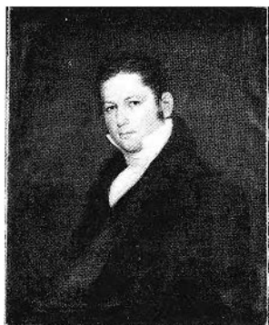
FIGURE 1. Joseph Légaré, Autoportrait , vers 1825. Sherbrooke, collection Louis Painchaud.

maintenant en voie de publication, une monographie rédigée à partir de milliers de documents en grande partie inédits. Cinq aspects sont évoqués : la biographie de Légaré à laquelle il faut joindre la chronologie des activités artistiques contemporaines, son rôle civique dans la ville de Québec, ses activités politiques, ses tentatives de diffusion de l'art et, enfin, sa production artistique. S'il fallait accorder plus d'importance à l'un des quatre premiers éléments, notre préférence irait à la diffusion de l'art pour les raisons suivantes. L'activité de Légaré fut à la fois soutenue et novatrice en ce domaine. D'autre part, il s'agit d'une partie encore à peu près inconnue de l'activité muséologique au Canada. On a en effet tendance à fixer l'origine des musées canadiens en 1842, lorsque Logan devint directeur de la Commission géologique du Canada. Or Légaré exposait sa collection de peintures dès 1829 et peut-être avant. Il fut également l'un des promoteurs de l'idée d'une galerie nationale dès 1845.