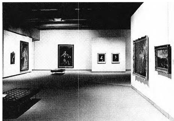
FIGURE 3. Joseph Légaré . Vue du montage au Musée des beaux-arts de l'Ontario.

Deux distinctions fondamentales s'imposent pour placer ce débat dans une juste perspective. En premier lieu, « l'histoire de la peinture occidentale du XIX e siècle » est loin d'être un monolithe formé tout entier de personnalités comme Ingres et David. S'obstiner, comme le font certains historiens de l'art canadien, à