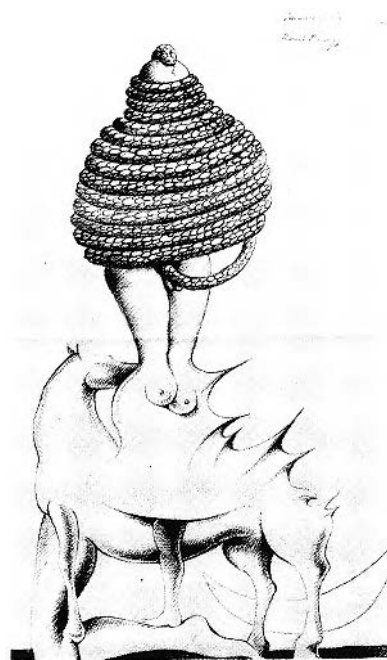
FIGURE 1. Cruzeiro Scixas et Raul Perez, Cadavre exquis , 1972. Coll. privée, Lisbonne.

LUIS DE MOURA SOBRAL (Univ. de Montréal) : Pratiques automatistes chez les surréalistes portugais . L'écriture automatique et les « Cadavres exquis » sont pratiqués dès 1936 par A. Pedro (Fig. 1). Transformations de poèmes traditionnels par l'introduction d'éléments irra-