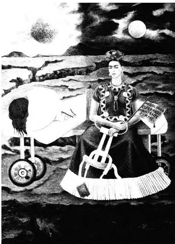
FIGURE 3. Frida Kahlo, Arbre de l'espérance, tiens bon , 1946. Coll. privée, New York.

les images sont très enracinées dans la réalité mexicaine; l'espace de ses tableaux (à la différence de ceux de Varo et de Carrington) est spécifiquement mexicain. Humour noir très dur, portant sur son vécu quotidien et douloureux (Fig. 3).