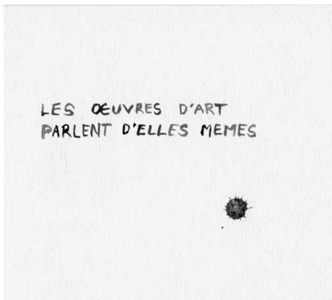
Figure 1. Mathieu Beauséjour, Les œuvres d'art parlent d'elles mêmes , aquarelle sur papier, 2007, collection particulière.

Aussitôt qu'une œuvre d'art exigerait, en dehors de ce doigt-index, une explication particulière, elle deviendrait par là même déjà imparfaite : puisque la première exigence du beau est cette clarté par laquelle il se déploie devant les yeux. 6