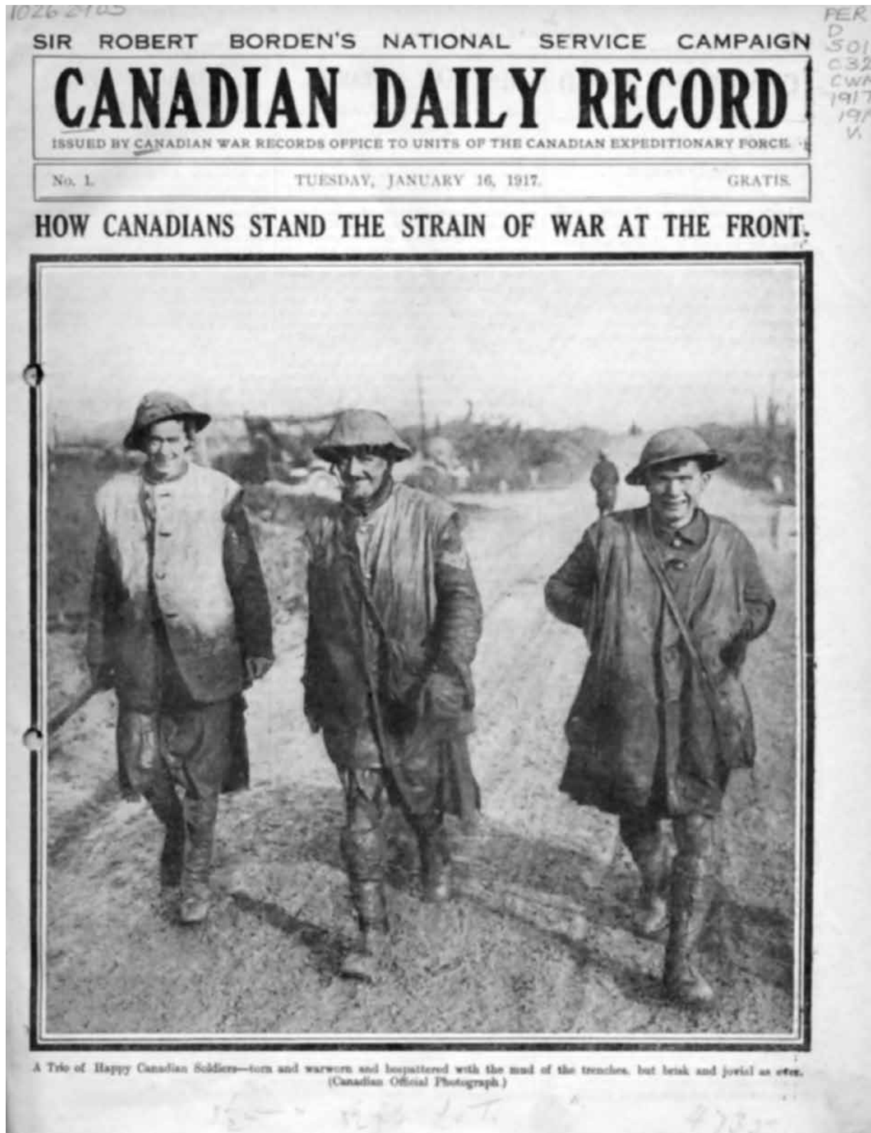
Figure 1. "A Trio of Happy Canadian Soldiers—torn and warworn and bespattered with the mud of the trenches, but brisk and jovial as ever;" Canadian Daily Record , no. 1, 16 January 1917, cover. Canadian War Museum, Hartland-Molson Library Collection, PER D501 C32.