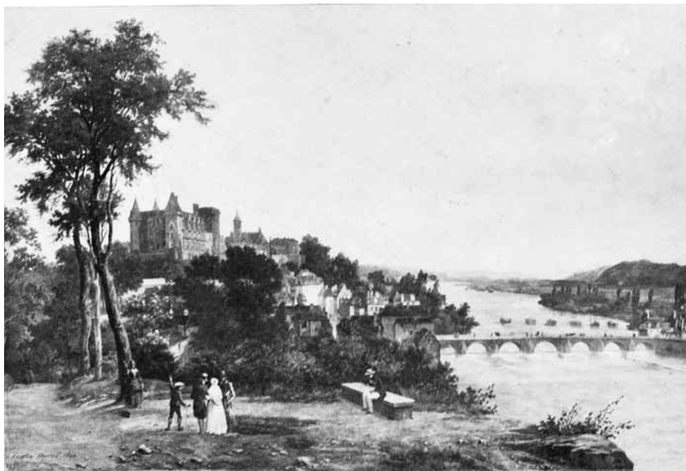
Figure 1. Édouard Baldus, Sans titre , épreuve sur papier salé, 22 x 33 cm, Paris, entre 1850 et 1859 © J. Paul Getty Museum.

L'affinité entre le travail de la matière picturale et celui de la matière photographique pénètre aussi les descriptions d'atelier. Peintres et photographes doivent lutter contre l'odeur des produits chimiques qui indispose les visiteurs et doivent se prémunir des taches en suivant les conseils dispensés par La Lumière , qui pousse l'analogie jusque dans le cabinet de toilette : « En résumé, étant données des mains chargées de produits photographiques aussi riches en tons et couleurs que la palette de Delacroix et de Diaz, on pourra toujours les rendre plus blanches et nettes en procédant de la manière suivante 18 [...] ». Cette comparaison sert d'introduction à une liste de recommandations numérotées impliquant l'usage d'acide hydrochlorique, de soude ou encore de cyanure de potassium, autant d'indices rappelant que l'auteur s'adresse à des spécialistes. De plus, l'analogie avec la peinture fondée sur la création des couleurs, les mélanges savants de pigments et de produits chimiques renvoie d'autant plus à une pratique traditionnelle que les peintres des