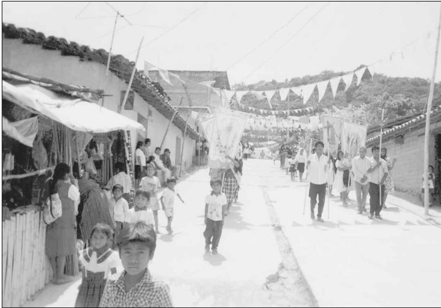
Des confréries de communautés voisines viennent visiter Barranca Tigre lors de l'Avent, pour y honorer le Santo Intierro

Montaña possède quelques gros camions capables de transporter des gens. Il suffit de remplir quelques sacs avec des écorces de café afin de rendre le voyage plus confortable et le tour devrait être joué. Un second problème lié au premier est celui du carburant. Étant donné qu'il s'agit de la principale dépense monétaire qu'auront à faire les participants, certains se demandent s'il ne serait pas possible d'obtenir quelque forme d'aide financière. Le curé affirme que l'évêché de Tlapa pourrait bien donner un appui de cette sorte. Quant à lui, il a déjà fait passer une quête spéciale [...] visant à appuyer les manifestants. Cette quête a rapporté 75 pesos. « Imaginez-vous, dit-il, en une seule quête... » La dernière question logistique est celle de la nourriture mais, comme c'est généralement le cas, elle est réglée assez rapidement. (Les femmes du groupe d'adoration nocturne prépareront les tortillas et la nourriture comme elles le font pour le pèlerinage à la Vierge immaculée en décembre.) [Notes de terrain, juin 2001]