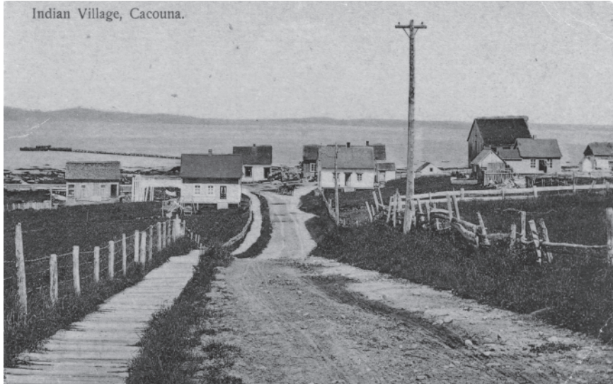
«Village indien» de Cacouna au début du xx e siècle (Carte postale)

être inscrits dans le registre des Indiens (AINC 2009). D'après les chiffres obtenus en 2006 auprès du conseil de bande de la Première nation malécite de Viger – qui a établi ses propres critères d'appartenance en 1987 –, les Malécites étaient près de deux fois ce nombre et en constante augmentation. Au Québec, l'idée d'une communauté malécite localisée demeure problématique : la réserve de Viger n'existe plus, celle de Whitworth – une terre de roche, au dire des Malécites – est quasiment déserte, et celle de Cacouna ne fait que 0,20 hectare.