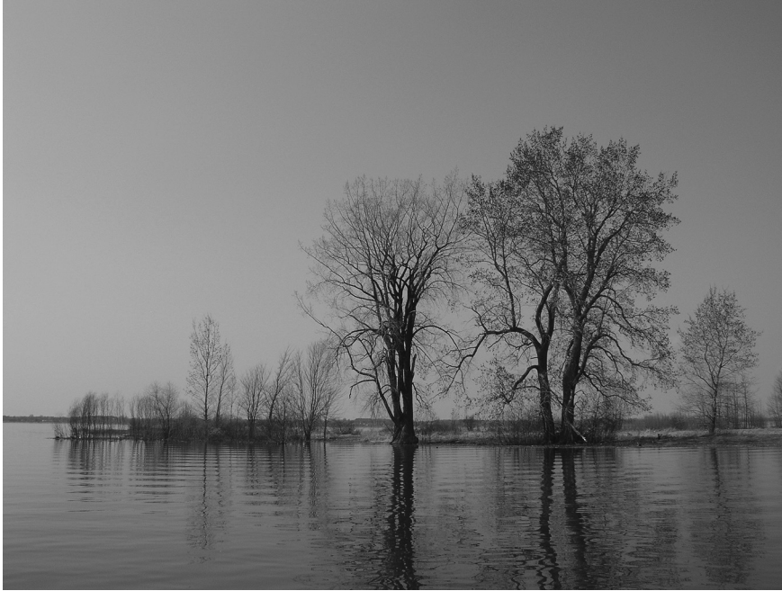
Les irréductibles, Réserve nationale de faune des îles de Contrecoeur (Photo d'Odette Patenaude, 2009)

prônait l'avènement d'un Québec indépendant, socialiste et laïque, tel que le rappelait récemment Gilles Bibeau :