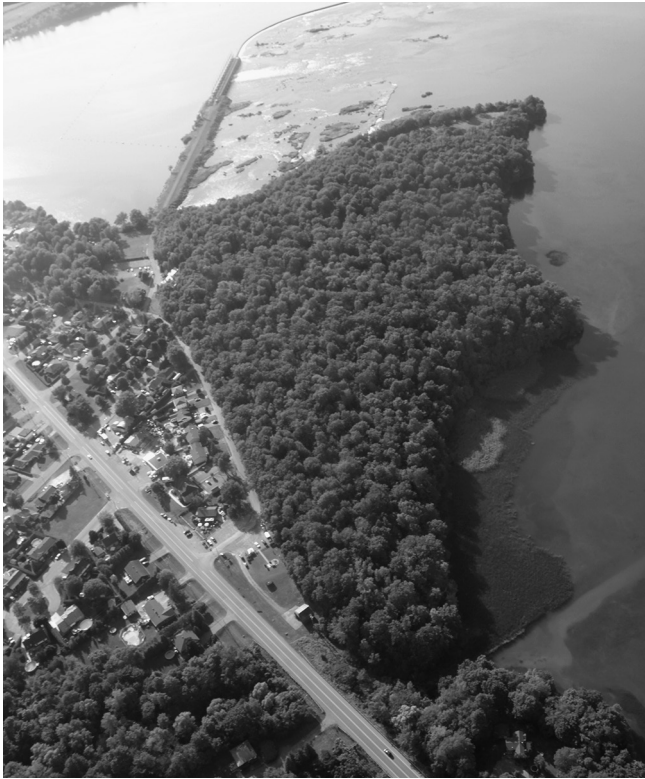
Vue aérienne de Pointe-du-Buisson, Beauharnois, 2011

l'effervescence intellectuelle du moment. Replaçons-nous dès lors dans ce contexte d'ébullition collective! Le Québec d'alors en est un de remise en question et d'éclatement des dogmes jusqu'alors imposés par la religion et par l'Église. Toute cette agitation sociale autour de la Révolution tranquille témoigne de l'énergie dans laquelle baigne cette génération de jeunes adultes, et surtout elle témoigne d'un réel désir d'affirmation nationale et culturelle, précurseur de la volonté d'une souveraineté politique totale du Québec, une souveraineté qui se veut une condition indispensable au développement des ressources humaines, physiques et économiques de la collectivité québécoise.