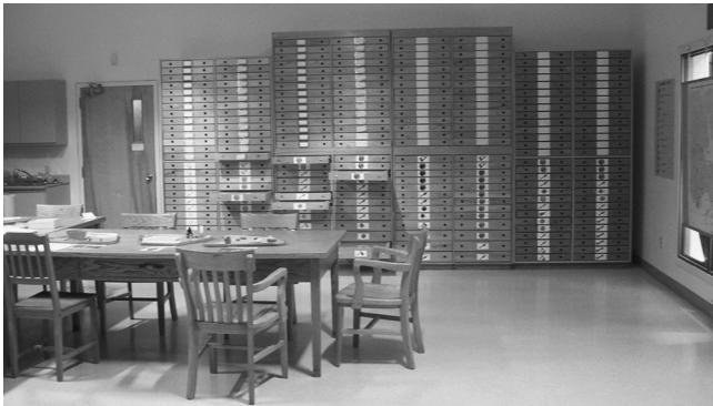
Laboratoire-réserve, Pointe-du-Buisson / Musée québécois d'archéologie, 2008

La période de 1910 à 1965 voit la construction de chalets de pêche et l'installation de plusieurs familles pendant la saison estivale, sans compter les nombreux campeurs admis sur les lieux. Cet épisode qui connaît l'émergence d'une pêche commerciale sera marqué par la présence d'Hector Trudel, un pêcheur chevronné surnommé « le Roi du Buisson ». La construction d'un barrage hydro-électrique dans les années 1950 mettra fin à une longue séquence d'occupation des lieux à des fins de subsistance.