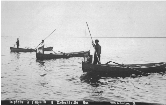
Pêche à l'anguille à Beauharnois au début du xx e siècle