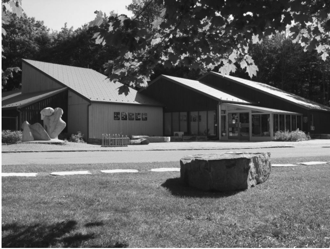
La Pointe-du-Buisson / Musée québécois d'archéologie, 2011