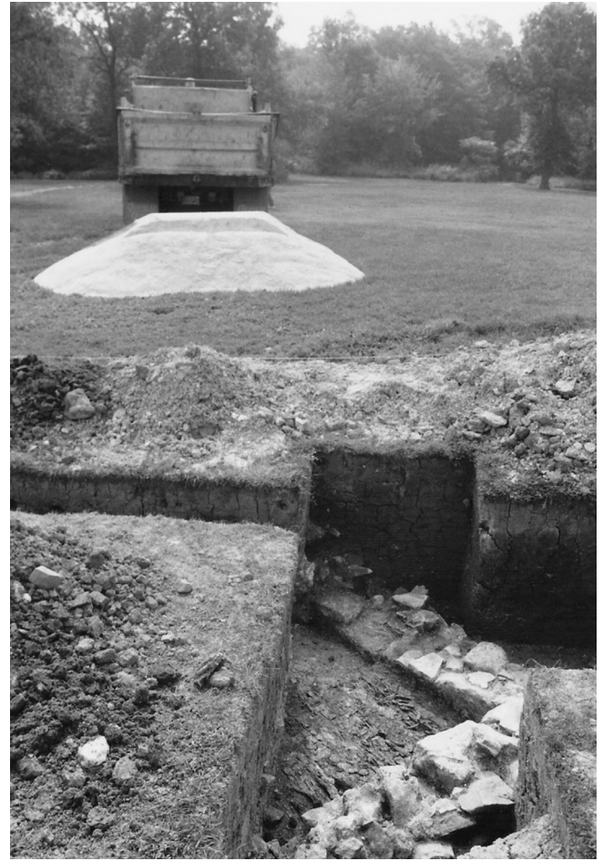
Site de la Villa Ellice, Pointe-du-Buisson, Beauharnois, 1992

Incontournable pour les communautés amérindiennes, la pointe l'est aussi devenue pour les sociétés modernes... Ses magnifiques rapides, maintenant harnachés, ont, depuis la genèse du grand Fleuve, représenté un arrêt obligé qui pouvait donner lieu à des moments de farniente appréciés de tous!