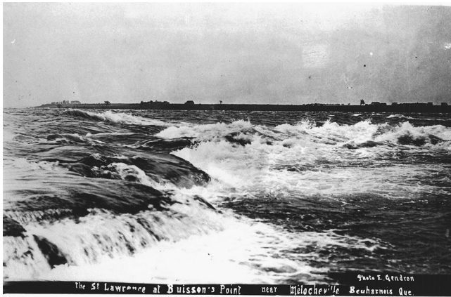
Les rapides, à Pointe-du-Buisson, Beauharnois, début du xx e siècle

tomahawks, des flèches et divers ustensiles en pierre » (Leduc 1920). Ce sont ces écrits et d'autres, conjointement avec la riche tradition orale de Beauharnois, qui ont mis la puce à l'oreille des membres de la SAPQ pour amorcer les fouilles archéologiques à cet endroit.