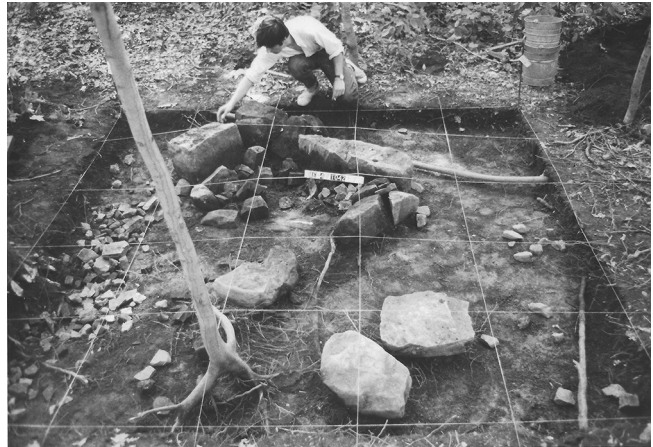
Aire de fouille avec quadrillage sur la station 4 de Pointe-du-Buisson, saison 1968