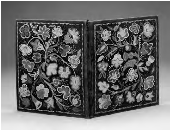
Figure 1 Porte-documents, wendat, 1830-1840; peau noircie, poil d'original (Collection Whitecloud, Galerie d'art de New Orleans, TMW [1] -118)