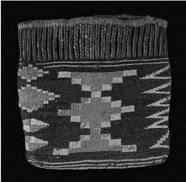
Figure 8 Sac à tabac, wendat, avant 1725; fibre végétale, poil d'original, porc-épic, 12,5 x 10,75 cm (Collection de Sir Hans Sloane, British Museum Am, SLMisc.203) [Trustees du British Museum]

Grands Lacs au XVIII e siècle. Ces caractéristiques se sont perpétuées dans les œuvres commerciales et diplomatiques wendates du XIX e siècle.