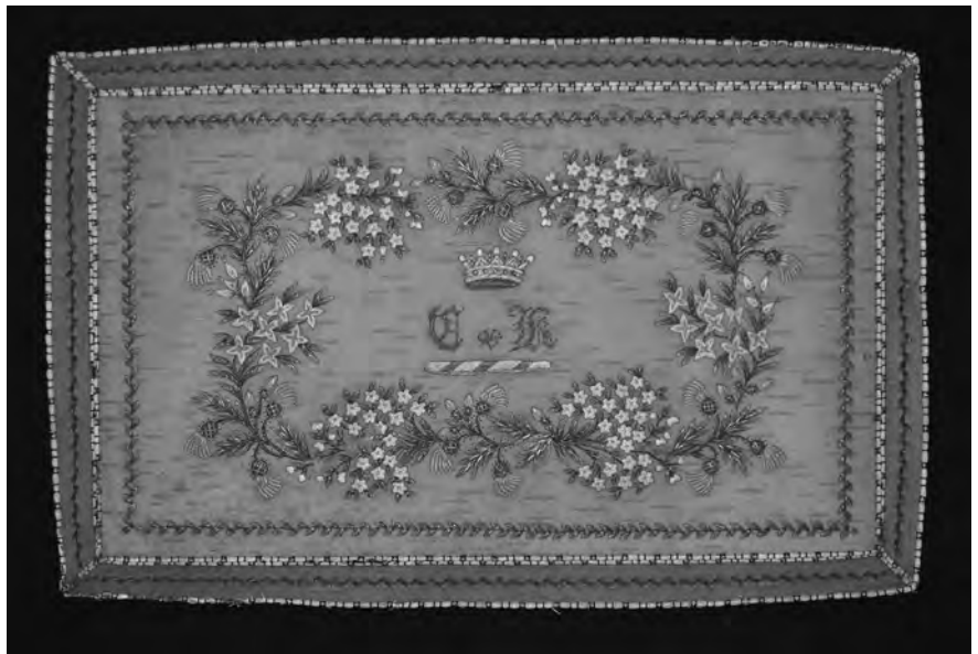
Figure 4 Plateau, wendat, 1847-1852; écorce, poil d'orignal, fil de coton, 38,7 x 24,7 cm (Collection Elgin, Musée canadien de l'histoire, Gatineau, 2008.118.10)

Il est plausible de penser que les spirales que l'on retrouve sur les mocassins sont une continuation des spirales en cuivre d'avant le contact. En tant qu'objets