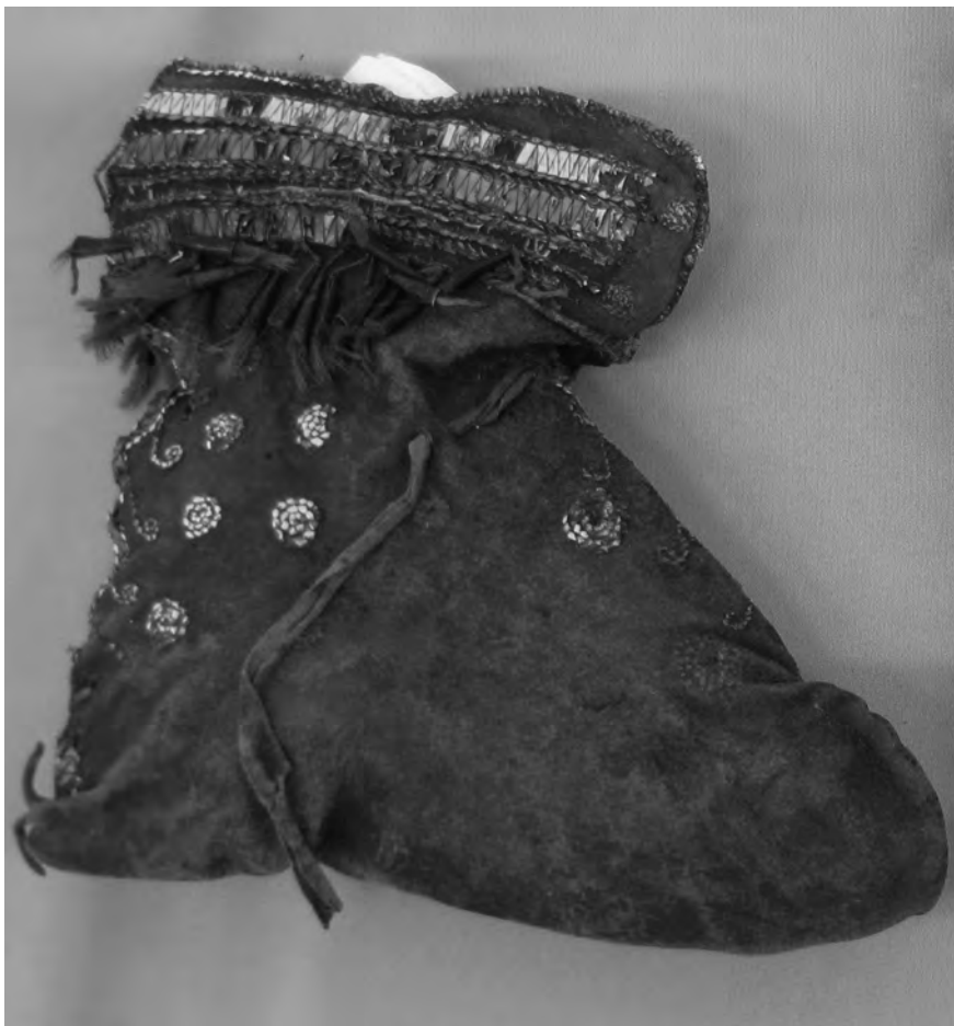
Figure 6 Mocassins, est des Grands Lacs, début du XVIII e siècle; peau noircie, piquants de porc-épic, tendon; gauche : 20 x 21 cm; droit : 24 x 24 cm (Musée du quai Branly, Paris, 71.1878.32.138)