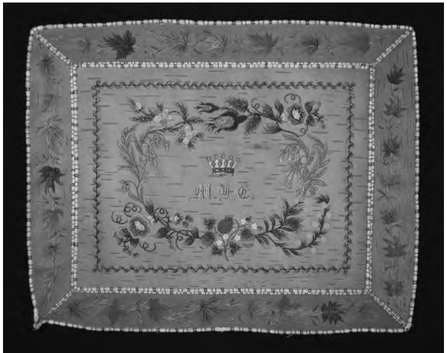
Figure 5 Plateau, wendat, 1847-1852; écorce, poil d'orignal, fil de coton (Collection Elgin, Musée canadien de l'histoire, Gatineau, 2008.118.09)