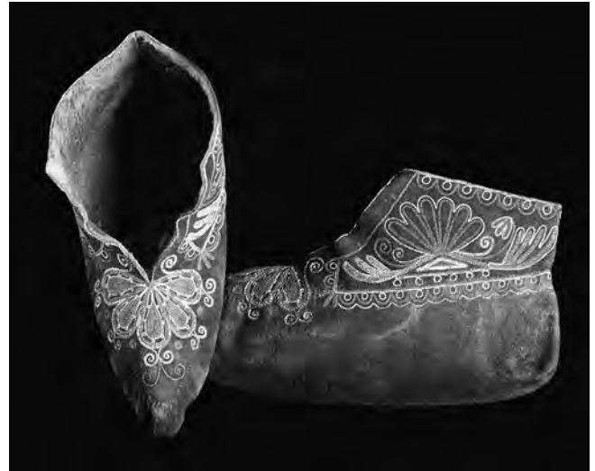
Figure 9 Mocassins, wendats, 1825; peau noircie, poil d'original, fil de coton, métal, poil d'animal (Collection de Lukas Vischer. Reproduit avec la permission du Museum des Kulturen, Bâle, IV_a_13_a_b)

Le commerce artisanal a connu un certain essor au début du XIX e siècle, et la créativité et l'innovation ont fleuri, entraînant une grande diversité de formes et de styles artisanaux. Le nombre de visiteurs européens, anglais plus spécifiquement, a augmenté, et les nouveaux motifs