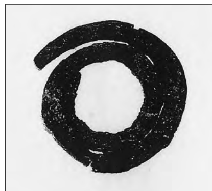
Figure 7 Spirale en cuivre, wendate, site de Warminster, vers 1615 (Tiré de : Anselmi 2008 : 559)

Peu d'œuvres appartenant à des collections autochtones du XVIII e siècle peuvent être considérées de façon sûre comme étant d'origine wendate, mais un sac tissé, appartenant maintenant au British Museum, constitue une rare exception. Documenté comme étant de provenance wendate, il a été recueilli avant 1725 (fig. 8). Très simple en apparence, ce sac à tabac se révèle comme un chef-d'œuvre de technique et de design abstrait, portant des symboles qui suggèrent des significations spirituelles. Tissé