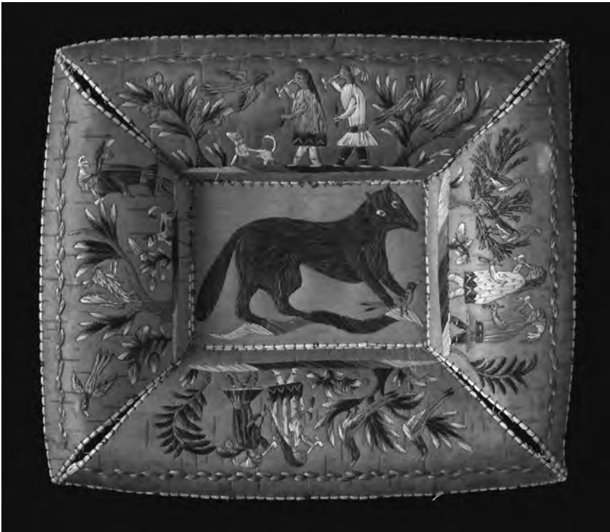
Figure 10 Plateau, wendat, milieu de XIX e siècle; écorce de bouleau, poil d'original, fil de coton (Reproduit avec la permission du Peabody Essex Museum, Salem, E77743)

le blanc, tel que mentionné dans la discussion des œuvres du XVIII e siècle, expriment la vie, la lumière, l'esprit et la connaissance. Le bleu rappelle la fumée du tabac sacré et la communication avec le monde des esprits (Hamell 1983 : 6). Transmis d'une génération à l'autre, ces motifs et ces couleurs sont semblables à ceux des objets fabriqués un siècle plus tôt et ils ont possiblement porté les mêmes significations symboliques.