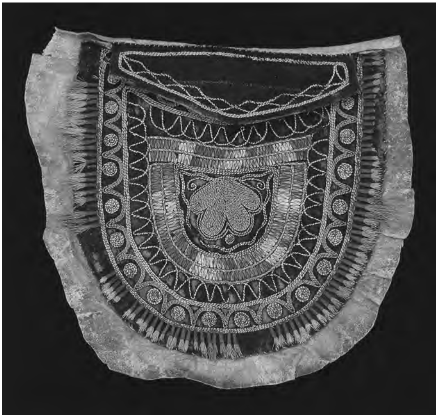
Figure 1 Sac à fond de forme ronde, probablement huron-wendat, peut-être acquis par Charles, premier marquis et second comte Cornwallis (1738-1805) Peau de chevreuil tannée à la cervelle, poils d'orignal et de chevreuil, piquants de porc-épic, fer étamé, tendon. Largeur 21,6 cm (Collection Thaw, Fenimore Art Museum, Cooperstown, New York, n° cat. T280.)