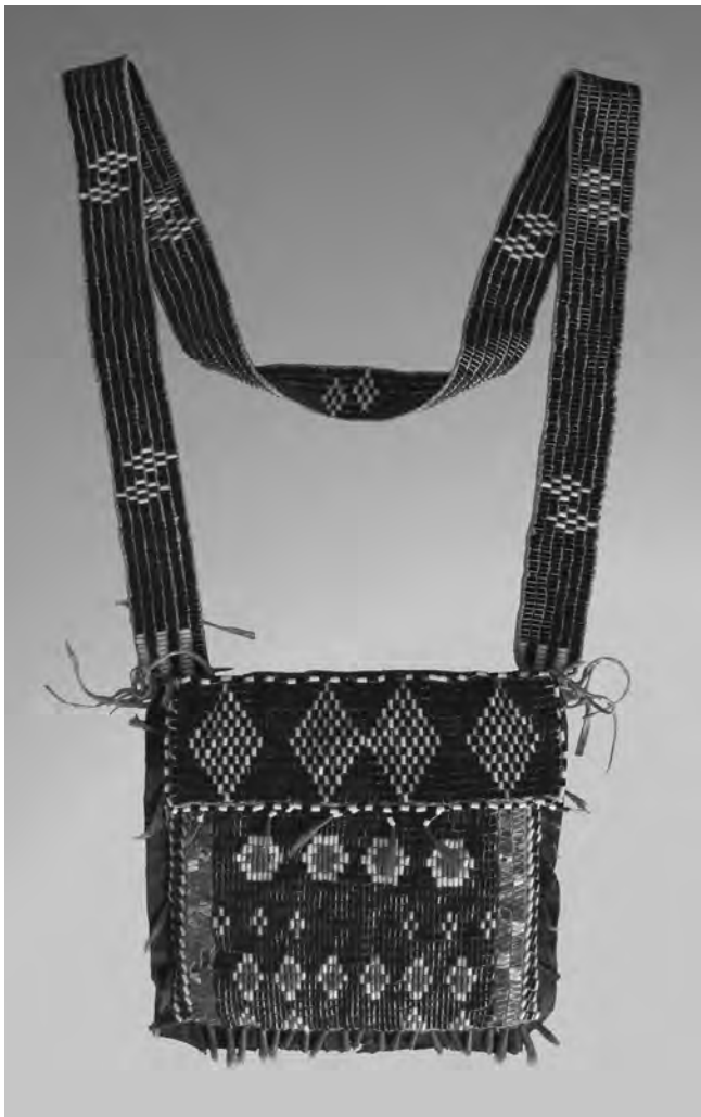
Figure 8 Sac de forme carrée porté en bandoulière, d'attribution iroquoise mais plus probablement de provenance abénaquise/penobscote, acquis par August Wilhelm Du Roi sur les rives supérieures de la rivière Chambly ou Richelieu en 1778 Peau de chevreuil tannée à la cervelle, poils de chevreuil, fer étamé, piquants de porc-épic, perles de verre, toile de lin, ruban d'étoffe croisée, fil de coton. Largeur 19,6 cm (Niedersächsisches Landesmuseum Braunschweig, Brunswick, Allemagne, n° cat. VMB 7250. Photo de Nikolaus Stolle)

de tissu teint en noir; ils sont décorés de fils qui ressemblent aux décorations en poils d'orignal, des jambières décorées de perles, une chemise imprimée en coton et un manteau de tissu ceint d'une bande de laine qui ressemble à une ceinture fléchée. Une hache, une corne à poudre et un fusil sont glissés à l'intérieur de la ceinture, et un étui en tissu noir décoré de fil et contenant un couteau, ainsi qu'un sac en tissu noir au bas arrondi dont le rabat pentagonal est brodé de fils blancs, rouge délavé et verts, y sont attachés. On peut même distinguer un motif floral central encerclé par un simple zigzag et deux lignes droites.