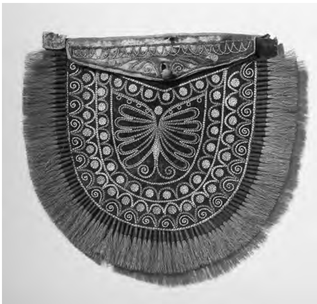
Figure 2 Sac à fond de forme ronde, probablement huron-wendat, don d'Adolf Gerber en 1826 Peau de chevreuil tannée à la cervelle, poils d'original et de chevreuil, fer étamé, « tendon » de calicot. Largeur 20,3 cm (Musée historique de Berne, Suisse, n° cat. Can. 11.)

matériaux bruts en tannant les peaux, en collectant les poils d'original ou les piquants de porc-épic, qui devaient être dégraissés et teints pour l'ornementation, et en extrayant et raclant la babiche avant l'apparition du fil trouvé dans le commerce 1 . Grâce à leur incroyable savoir-faire, elles transformaient ces matériaux en objets d'une beauté exquise servant autant aux activités quotidiennes qu'aux cérémonies pour elles-mêmes et leur famille.