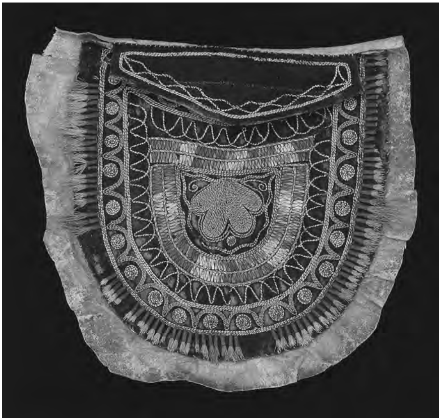
Figure 1 Sac à fond de forme ronde, probablement huron-wendat, peut-être acquis par Charles, premier marquis et second comte Cornwallis (1738-1805) Peau de chevreuil tannée à la cervelle, poils d'original et de chevreuil, piquants de porc-épic, fer étamé, tendon. Largeur 21,6 cm (Collection Thaw, Fenimore Art Museum, Cooperstown, New York, n° cat. T280.)