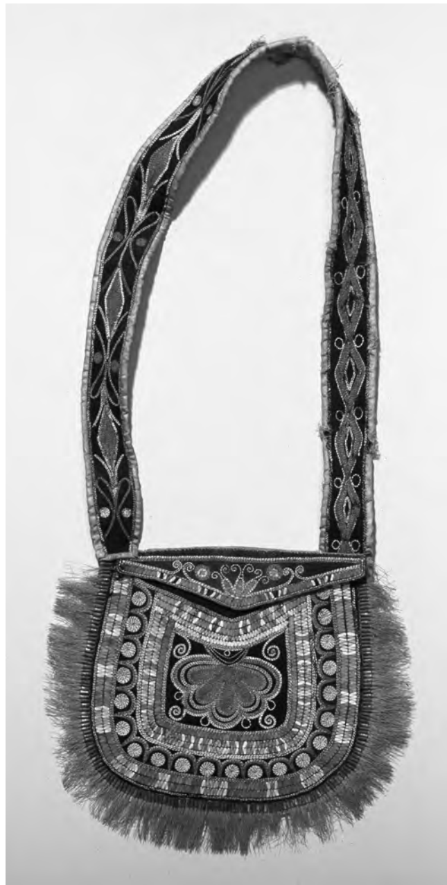
Figure 3 Sac à fond de forme ronde porté en bandoulière, probablement huron-wendat, réputé avoir été acquis par le comte Albert-Alexandre de Pourtalès en 1832

Toujours attachée, la courroie d'épaule est faite d'une bande de peau de chevreuil d'un noir tirant sur le brun et dont les moitiés sont décorées de deux différentes appliques de poils d'original. Un côté est garni de losanges concentriques, bordés de cercles, et l'autre de losanges accompagnés de boucles et de cercles. La bretelle est renforcée de lin naturel. Un sac ayant une décoration presque identique comporte des piquants dont l'ordre des couleurs est