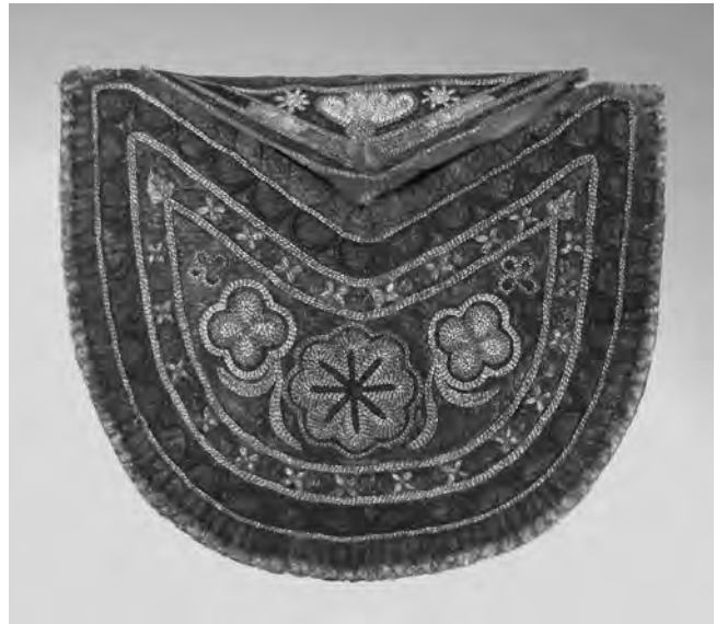
Figure 5 Sac à fond de forme ronde, d'attribution huronne-wendate, acquis d'Arthur Speyer fils. Il fut probablement obtenu en 1852 à Niagara Falls, tel que mentionné au dos de l'objet Peau de chevreuil tannée à la cervelle, poils d'original, fil de coton. Largeur 19,5 cm (Ethnologisches Museum, Berlin, Allemagne, n° cat. IV B 12731. Photo de Nikolaus Stolle)

de poils d'original. Le tout est conservé au département d'ethnographie du Musée national du Danemark à Copenhague (n° de cat. EHC146g). Le sac est fait de deux pièces de peau de chevreuil mi-arrondies. Son devant, noir tirant sur le brun, est plus petit que le dos qui est plus pâle, et il mesure 18,7 cm sur 24 cm (Harrison et al. [dir.] 1987a : 70). Un rabat pentagonal, pointant vers le bas, est cousu au dos et est percé d'une boutonnière. Le bord extérieur du sac est garni de cônes de fer étamé placés parallèlement et remplis de poils de chevreuil teints en rouge et blanc, placés par ensembles en alternance.