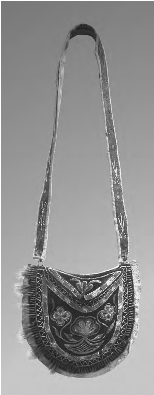
Figure 4 Sac à fond de forme ronde porté en bandoulière, d'attribution huronne-wendate, acquis d'Arthur Speyer fils et remontant à 1840 environ Peau de chevreuil tannée à la cervelle, poils d'original et de chevreuil, piquants de porc-épic, fer étamé, métal, toile de lin, fil de coton. Largeur 20 cm (Städtische Museen Freiburg, Fribourg-en-Brigau, Allemagne, n° cat. III-68-1950. Photo de Nikolaus Stolle)