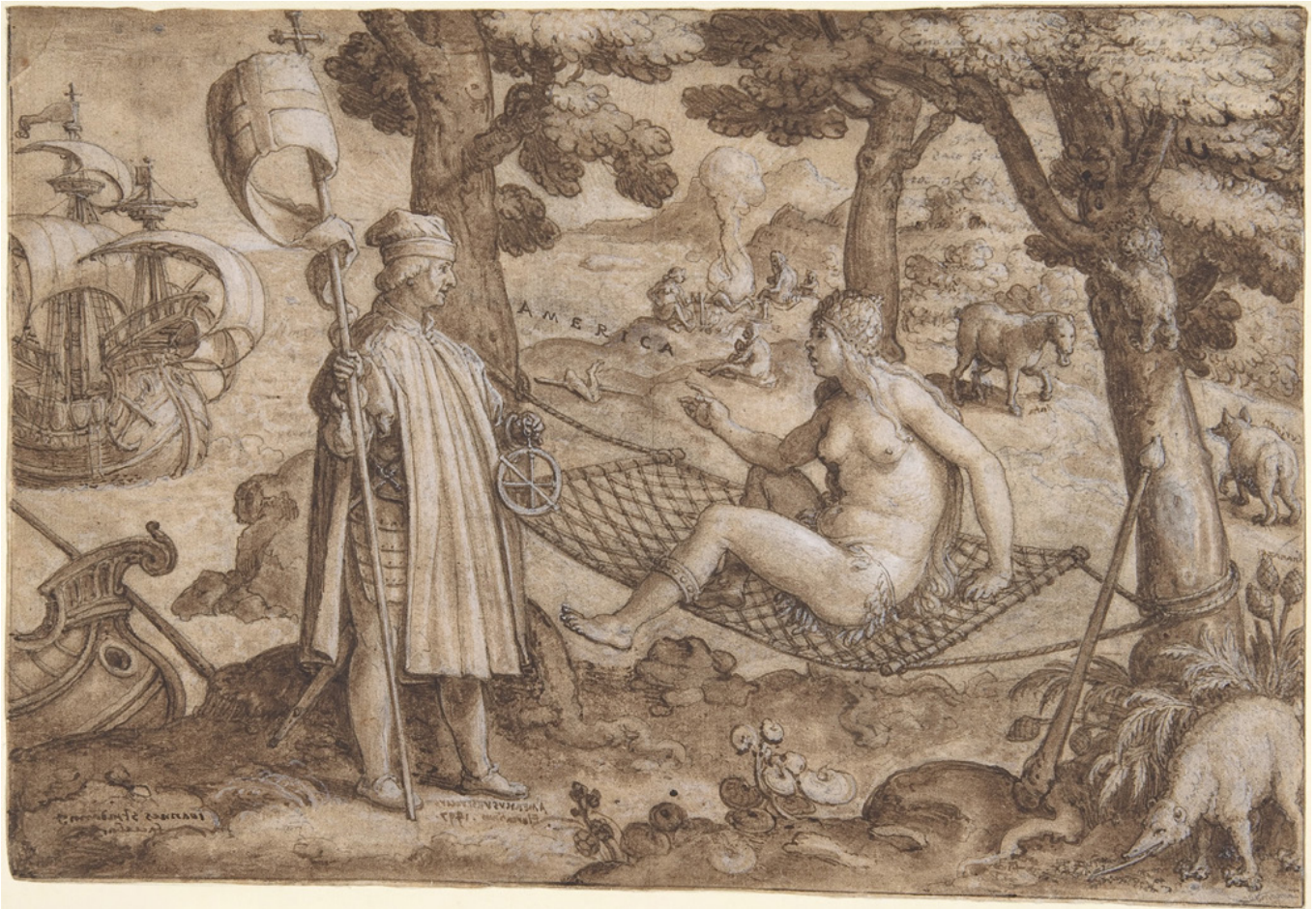
Figure 2 "Discovery of America. Vespucci Landing in America. 1587-89"