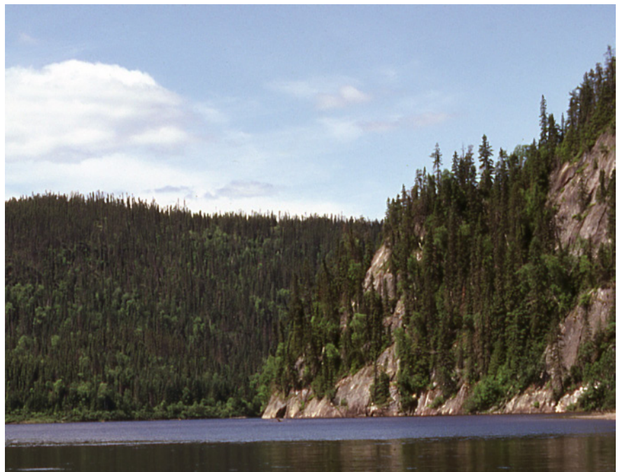
Figure 4 Cran dans la falaise rocheuse à la Fourche Péribonka-Manouane

projet Tshishipiminu décrivait ce même paysage qu'elle avait connu avant la construction du barrage :