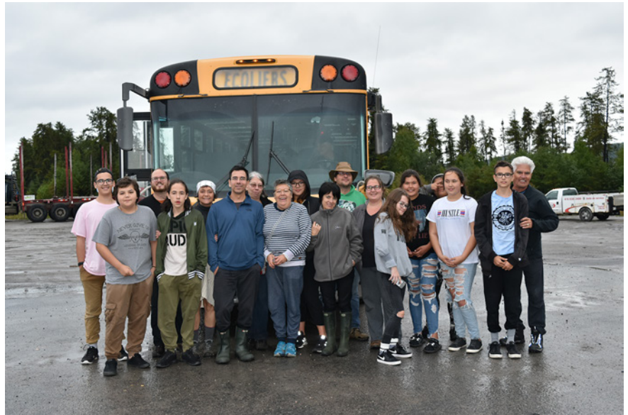
Figure 3 Visite à la Fourche Péribonka-Manouane avec des jeunes de Kassinu Mamu

Les membres du partenariat Tshishipiminu ont visité ensemble le site des Fourches à deux reprises, la première fois pendant l'été 2013 et la deuxième, à l'automne 2018 (fig. 3). Le contraste entre ces deux journées n'aurait pas pu être plus marquant. La première visite se fit en petit groupe sous un soleil resplendissant. Après avoir observé le paysage en surplomb depuis le belvédère aménagé près du barrage Péribonka IV, nous sommes ensuite descendus jusqu'aux berges de la rivière Péribonka afin de poser un autre regard sur les lieux. La deuxième visite quant à elle s'est faite sous un ciel gris et orageux. Nous étions en compagnie d'étudiants de l'école secondaire Kassinu Mamu et, malgré la pluie battante, nous avons cette fois traversé la rivière en canots à moteur pour marcher sur la « Pointe du cran ». Sous nos pieds se trouvaient peut-être des traces archéologiques de l'occupation des Pekuakamiulnuatsh, mais il suffisait de lever le regard pour repérer le « cran » qui donne son nom au site, soit la fente dans la roche qui agit comme une charnière entre les mondes et les générations. Lors d'entrevues qualitatives menées au début de nos travaux, une jeune participante au