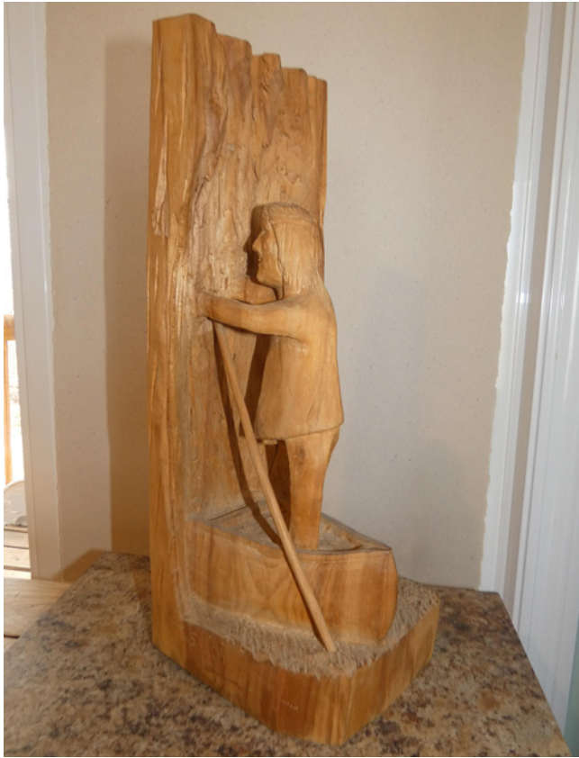
Figure 5 Katimaweshu, sculpture de Thomas Siméon

Péribonka un élément bien connu du paysage innu qui est documenté à l'échelle de l'aire culturelle algonquienne, et au Québec plus spécifiquement par des historiens, ethnologues et archéologues de l'Université Laval. Dans son livre sur les croyances et rituels des Innus, Jean-Louis Fontaine note que les anciens « acceptaient la présence d'une puissance mystique dans chaque composante de la nature » et « requéraient l'aide des forces invisibles non seulement pour faire bonne chasse, mais également pour entreprendre de bons voyages » (Fontaine 2006 : 35). Fontaine souligne que ces suppliques de bonne fortune s'inscrivaient souvent dans des lieux particuliers : « De temps à autre, et aux endroits désignés depuis des générations, les gens s'arrêtaient tout au long de leur route afin de rendre hommage et de prier les esprits » ( ibid. ). Comme l'analyse de Fontaine est fondée sur les archives du Régime français, il se réfère aux relations du Père Paul Le Jeune pour illustrer l'importance et le sens conféré à ces lieux d'arrêt le long des routes de canot :