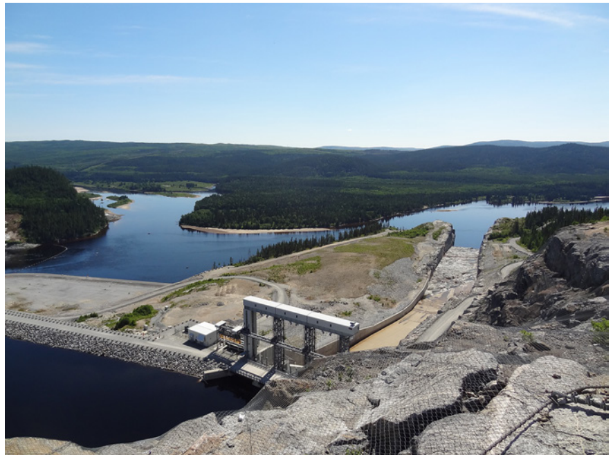
Figure 2 Fourche Péribonka-Manouane vue du haut du barrage Péribonka IV (Photo de Caroline Desbiens)

À la fois concept et objet, le « paysage culturel » constitue l'un des plus importants domaines d'application des politiques patrimoniales, que ce soit à l'échelle locale ou internationale. Mais ce paysage est-il une entité physique ou intangible? L'appropriation de l'espace implique des pratiques matérielles, mais aussi des idées, croyances, valeurs, savoirs et relations qui s'entrelacent dans les lieux et, par ces associations, humanisent la terre (Cresswell 2014; Meinig 1979; Sauer 1925; Tuan 1977; Vidal de la Blache 1948). Mais, comme en témoignent la majorité des sites qui figurent sur la liste du patrimoine mondial de l'UNESCO, les politiques de patrimonialisation se sont surtout saisies des paysages physiques au détriment des paysages intangibles. L'une des raisons est que l'architecture et le milieu bâti occupent et délimitent l'espace de manière visible, surtout lorsqu'ils présentent un caractère monumental (Taylor, St-Clair et Mitchell 2014). Il demeure que les traces matérielles à elles