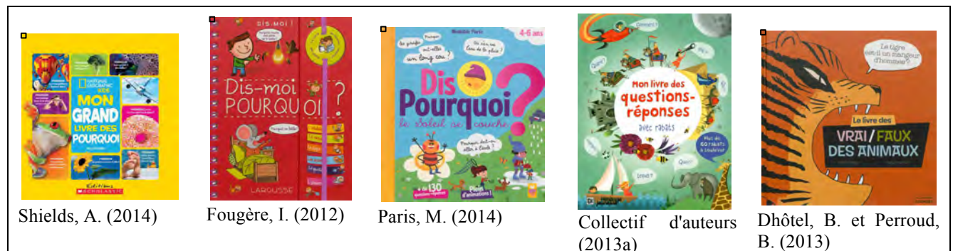
Tableau 5 - Exemples d'albums documentaires suscitant des questionnements

Comme mentionné précédemment, la lecture doit être interactive, c'est-à-dire qu'elle doit favoriser la discussion autour du texte et des images, et cela, avant, pendant et après la lecture (Giasson, 2003; Santoro et al. , 2008; Yopp et Yopp, 2012). Dans un contexte de lecture d'albums documentaires visant le développement du vocabulaire et de connaissances sur le monde, les interactions seront en grande partie centrées sur les concepts (Giasson, 2003). À cet égard, la fonction informative de l'image devra être mise à l'avant plan, c'est-à-dire qu'il s'agira de faire prendre conscience aux enfants que celle-ci ne fait pas que coexister avec le texte, mais