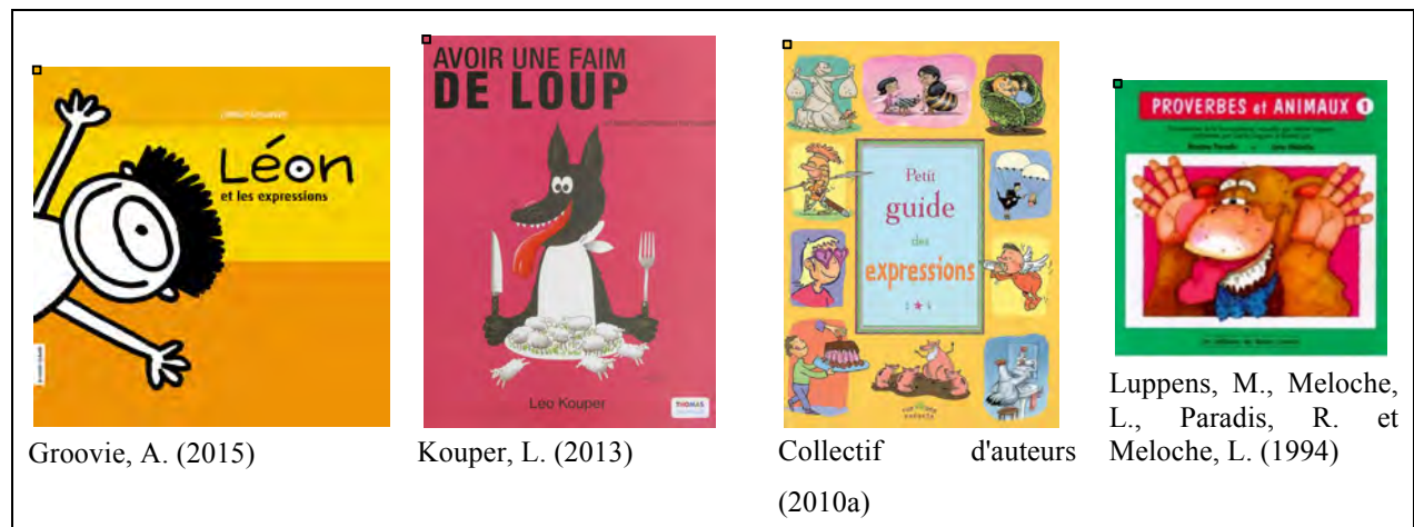
Tableau 7– Exemples d'albums documentaires permettant de réfléchir au sens des expressions et des proverbes

La compréhension des expressions et des proverbes demeure complexe pour les enfants qui accèdent difficilement au sens figuré qu'elles véhiculent. À cet égard, il peut être intéressant de recourir aux albums qui abordent ces expressions et proverbes sur un ton souvent humoristique, confrontant parfois le sens littéral au sens figuré, comme le fait le livre Léon et les expressions (Groovie, 2015). Le tableau 7 présente des exemples de volumes qui offrent des occasions riches et amusantes de réflexions et de discussions à propos de la signification d'expressions ou de proverbes dont le sens réel n'est généralement pas connu des enfants.