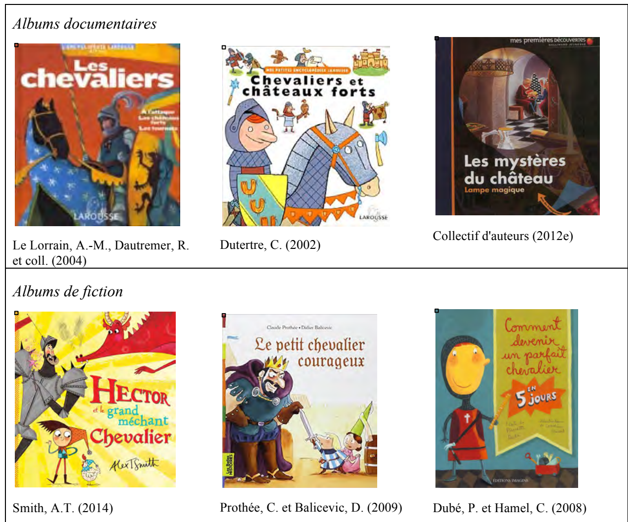
Tableau 12 - Exemples d'albums documentaires et de fiction sur le thème des chevaliers