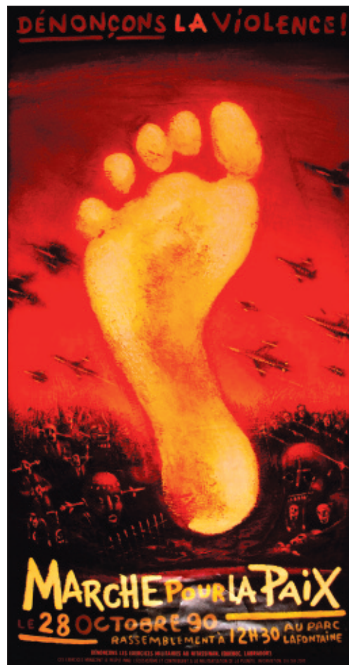
Communauté innue du Nitassinan, affiche, 99 x 54,5 cm. Artiste: Richard Parent, 1990