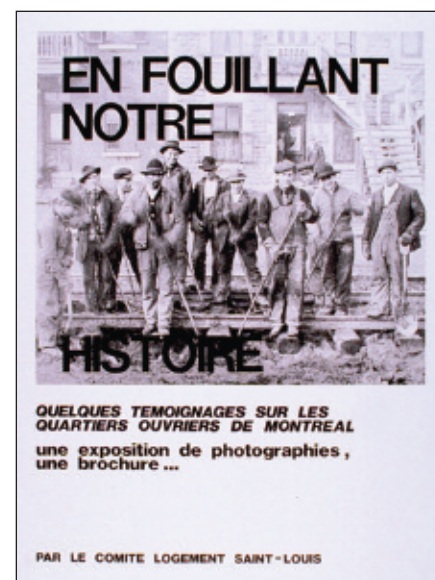
Comité logement Saint-Louis, affiche, 53 x 40,5 cm, 1981

« Il existe une entente tacite entre les générations passées et la nôtre. Sur Terre, nous avons été attendus. »