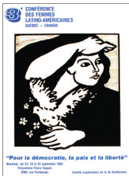
Comité organisateur de la 3 e Conférence des femmes latino-américaines, affiche, 56 x 43 cm, 1983