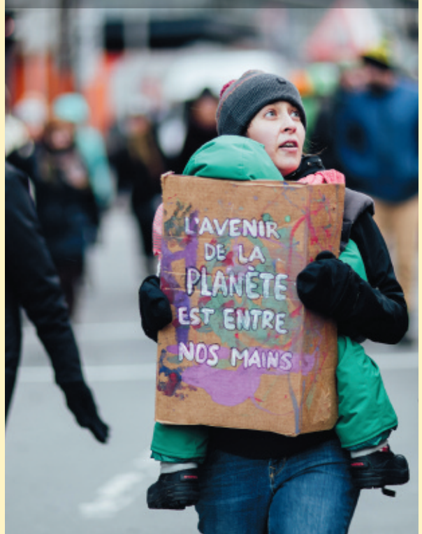
Manifestation La planète s'invite au Parlement à Montréal, le 10 novembre 2018.