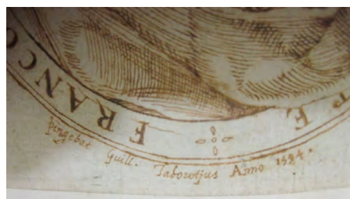
Fig. 2. Dessin à l'encre figurant Jean-Antoine de Baïf, signature autographe de Guillaume Tabourot, 1594. Copie d'un portrait gravé et détail de la signature. France, collection particulière.