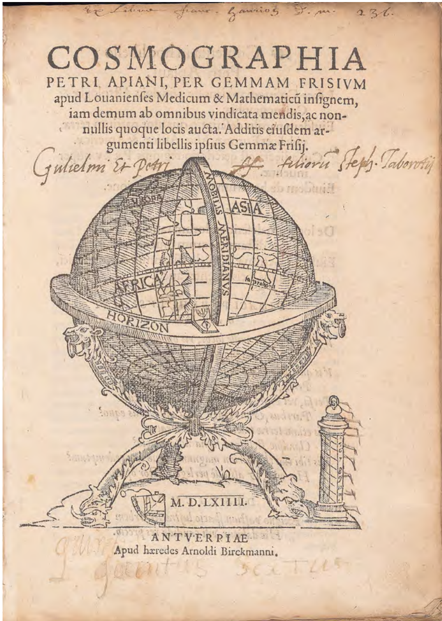
Fig. 3. Ex-libris des frères Guillaume et Pierre Tabourot, fils d'Étienne Tabourot. Yale, Beinecke Library, cote Eq21 564A.