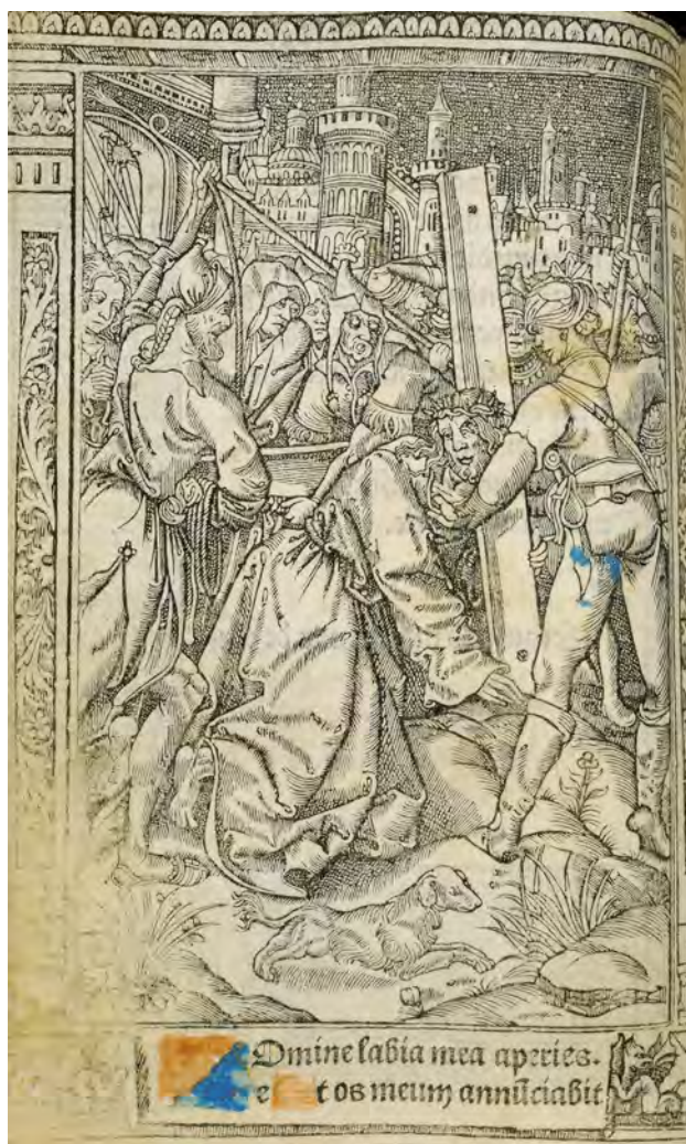
Fig. 5. Horae à l'usage d'Autun (Paris : pour Simon Vostre, v. 1507) [Montréal, Université McGill, Livres rares et collections spécialisées, cote Cuca R 66 H 1507, gravure du Christ portant la croix , fol. m4v o ].

la croix de Pichore. Cette dernière gravure aurait, quant à elle, été utilisée pour la première fois par Vostre en 1505 78 .