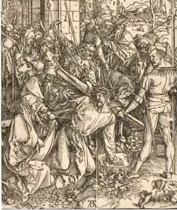
Fig. 6. Albrecht Dürer, La Grande Passion : Le portement de croix, gravure sur bois, v. 1498–1499, 38,4 x 28 cm. [Cabinet des Estampes et des Dessins de Strasbourg, numéro d'inventaire : 77.005.0.3].

La gravure de Pichore du Christ portant la croix est placée sans surprise au début des Heures de la Croix. Elle relate un épisode de la Passion, au moment où le Christ vient de tomber à genoux sous le poids de son fardeau. Le corps du Christ se tord sous la douleur et son regard est porté vers l'arrière. La composition est similaire à celle d'une gravure sur bois de Dürer, intitulée Le Portement de croix .