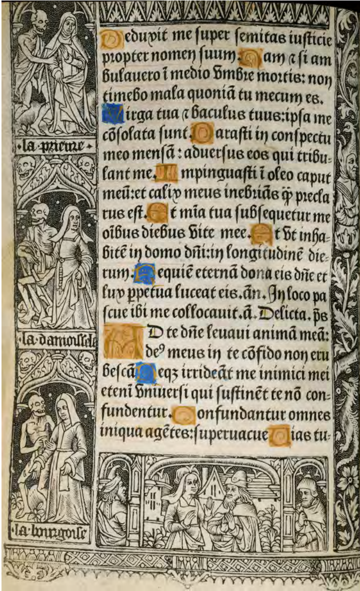
Fig. 1. Horae à l'usage d'Autun (Paris : pour Simon Vostre, v. 1507) [Montréal, Université McGill, Livres rares et collections spécialisées, cote Cuca R 66 H 1507, bordures de la Danse des Morts , fol. p6v°].