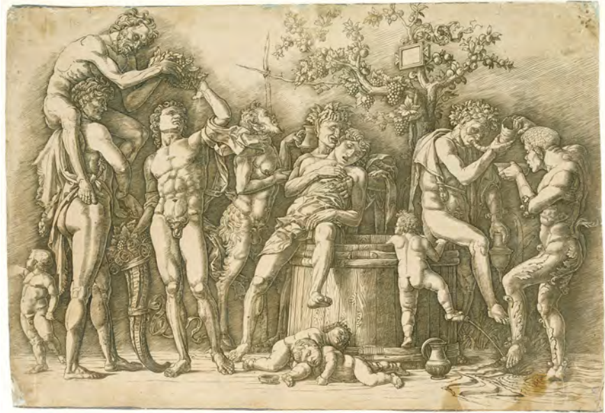
Fig. 7. Andrea Mantegna, Bacchanal with a Wine Vat , v. 1490, burin et pointe sèche, 29,8 x 43,8 cm [New York, The Metropolitan Museum of Art, numéro d'accession : 1986.1159].

On rencontre cette « laideur presque bestiale » dans d'autres œuvres de Mantegna. Si l'on regarde du côté de ses gravures, la Bacchanale à la cuve fournit un exemple probant.