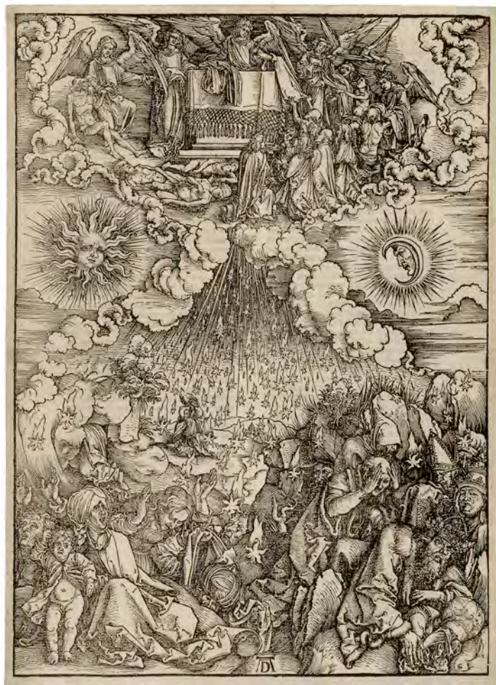
Fig. 4. Albrecht Dürer, L'Apocalypse (06) : L'ouverture du cinquième et du sixième sceaux, 1497, gravure sur bois, 39 x 28 cm. [Cabinet des Estampes et des Dessins de Strasbourg, numéro d'inventaire : 77.989.0.17].

L'influence de Dürer est présente également dans d'autres illustrations des Heures de Pigouchet pour Vostre, notamment dans celle du Christ portant