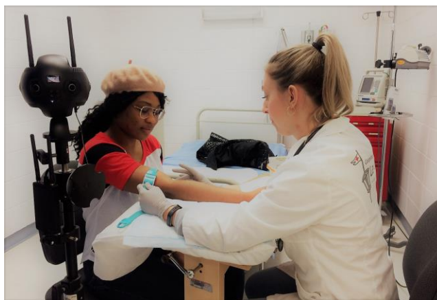
Photo 1 : Deux acteurs interprétant respectivement une patiente (à gauche) et une infirmière (à droite).