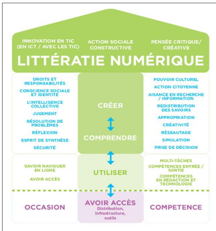
Figure 1 : Cadre de référence HabiloMédias

Toutefois, comme le montre le modèle, l'accès ne fournit pas automatiquement des occasions d'usage compétent et responsable. Le chemin vers des niveaux plus élevés de littératie numérique pourrait être différent pour chaque citoyenne et citoyen aux prises avec des défis numériques. Les résultats préliminaires de quelques études menées au sein de CompÉTICA (LeBlanc et al., 2015) rapportent que les compétences techniques dominent les pratiques pédagogiques, tandis que les compétences non techniques sont non seulement obscures et sous-développées, mais également difficiles à évaluer (Freiman et al., 2016 ; Freiman et al., 2017). Par conséquent, une recherche visant à approfondir les compétences et les attitudes et identifier les défis soulevés par les personnes expertes fut entreprise afin d'obtenir une perspective plus claire de leur parcours d'apprentissage et de permettre d'inspirer les pratiques éducatives futures.