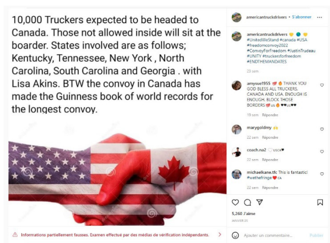
Figure 3- AmericanTruck Drivers, Guinness

Mais, sachant qu'une fausse nouvelle circule plus rapidement qu'un fait établi (AFP, 8 mars 2018) 18 , ces vérifications de faits ont bien des limites 19 en raison du clivage grandissant des opinions (Figeac et al., 2019). Figeac a expliqué que les algorithmes des moteurs de recherche tendent à trier, sélectionner et rendent visibles certaines sources d'informations, captant l'attention des internautes vers un petit réseau de sites web.