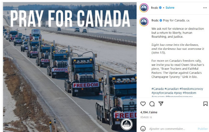
Figure 2- Family Research Council utilise une photo albertaine

Parmi les 20 publications les plus populaires selon les critères de la présente méthodologie, on retrouve quatre publications provenant d'un compte nommé BRock (@forestlarocks). Aucune biographie n'accompagne ce compte qui semble se vouer à republier des contenus provenant de sources ouvertement identifiées comme libertariennes, tels que @TrueNorth et le compte de @Roman_Baber, un élu du Parti conservateur de l'Ontario, défait depuis. En validant l'authenticité du compte par une recherche inversée dans Google Images pour trouver la source de la photo, il s'est avéré que cette photo de profil provenait du compte d'une pigiste offrant des services de rédaction, sur un site de rédacteurs indépendants au Manitoba. Avec 570 publications (voir Annexe 2), ce compte est aussi celui qui a le plus publié sous les hashtags les plus populaires dans la période où les données ont été collectées.