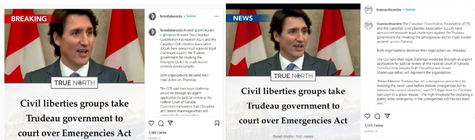
Figure 4 - BRock «scoop» le média indépendant True North

Les agents de circulation d'information comme le compte BRock ont relayé en masse la poursuite lancée contre le premier ministre Trudeau par des organismes « indépendants » caritatifs comme la Canadian Constitution Foundation , qu'un article paru sur CBC News (Crowe, 2015) associait à des sources de financement américaines avec d'autres « think tanks » de droite. À la figure 4, on retrouve une nouvelle qualifiée par la suite de « mésinformation » par des chercheurs dans la publication universitaire The Conversation (Dishart et al., 2022) en raison de l'utilisation d'un langage « pseudo-légal » qui a même berné des médias canadiens reconnus, comme le National Post ou le Toronto Sun . Il est à noter ici que le compte de BRock a publié cette exclusivité de l'organisme True North avant même le compte Instagram @truenorthcentre. Or, si la nouvelle de True North n'apparaît pas dans la liste des publications les plus vues sous les hashtags #FreedomConvoyCanada et #FreedomConvoyCanada2022, c'est que ce média indépendant d'enquête n'utilise jamais de hashtags .