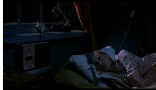
Figures 1 et 2 : L'Homme sans passé, scène du « coucher d'Irma » (Aki Kaurismaki, 2002, 00:19:34 et 00:20:11) © Arte vidéo.