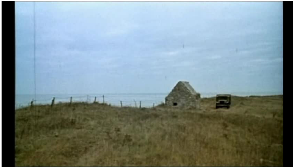
Extrait vidéo 1 : Générique de début de La Horse, 03:14-06:49

Cette disjonction complète entre la musique et le décor d'un côté, la musique et les mouvements plastiques de l'image de l'autre (même si le contraste reste modéré), offre d'emblée au spectateur un libre jeu d'hypothèses pour concilier cette musique avec les images présentées. Nous nous référons ici à la théorie gestaltiste appliquée à la musique de film qui postule que le cerveau cherche nécessairement à trouver une cohérence entre les significations exprimées séparément par les images et la musique – même lorsque celles-ci divergent – afin de faire émerger une « macro-configuration » satisfaisante (Audissino 2017). Dans cette optique, le titrage de couleur rouge peut venir préfigurer des crimes, offrant une correspondance directe entre les couleurs et la brutalité de la musique 35 (extrait vidéo 1).