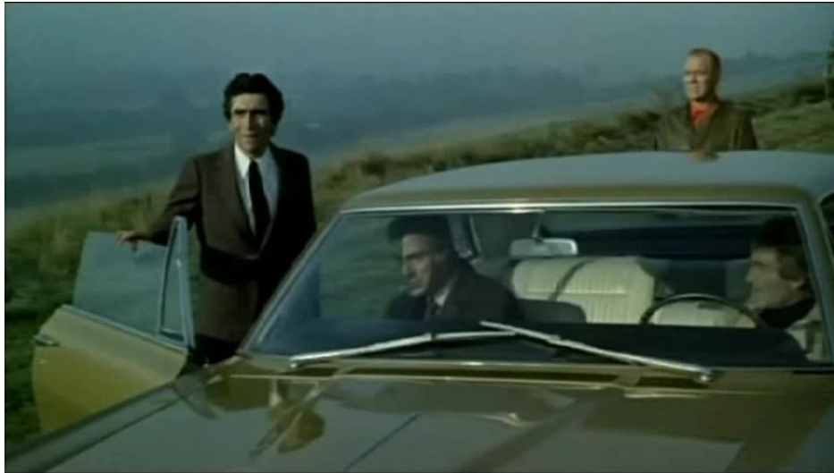
Extrait vidéo 4 : La Horse, 52:35-53:36 © M6 Vidéo.

Lors de l'occurrence suivante (extrait vidéo 5), l'association du thème principal – symbole de la violence des trafiquants – avec les paparazzis assimile ces derniers aux premiers : comme les trafiquants, les paparazzis viennent en effet de la ville et cherchent à « envahir » la famille Maroilleur en prenant des photos volées 37 . En se servant seulement de la musique pour dénoncer les excès de ce type de photographie, Granier-Deferre démontre la force de l'association musicale au cinéma en l'absence de tout commentaire parlé.