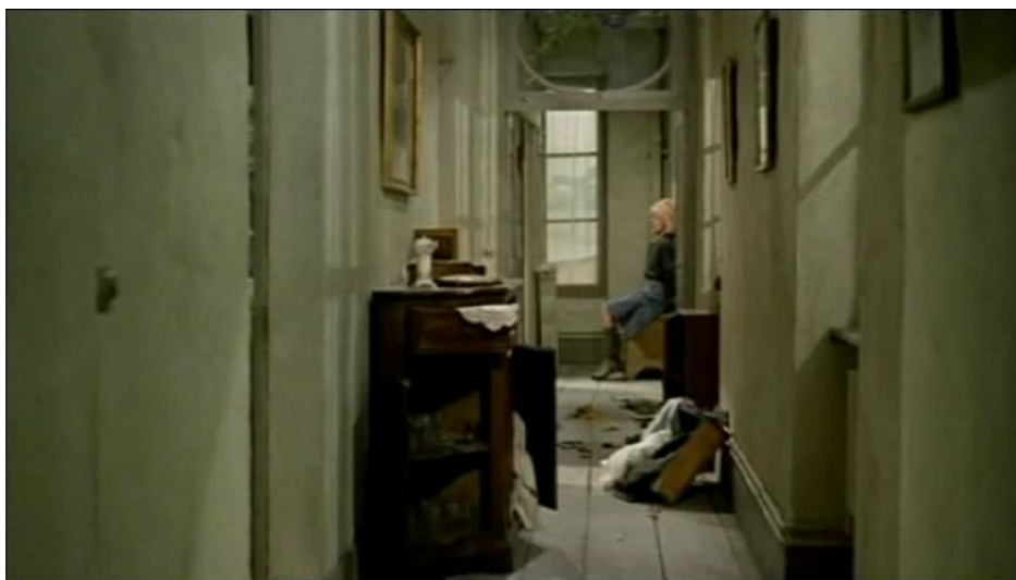
Extrait vidéo 8 : La Horse, 49:17-49:52 © M6 Vidéo.