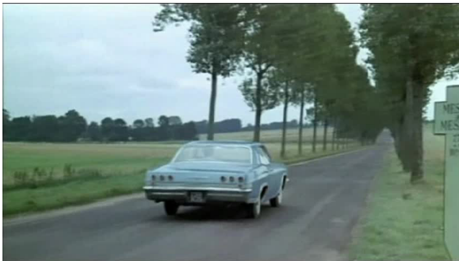
Extrait vidéo 6 : La Horse, 14:34-15:07