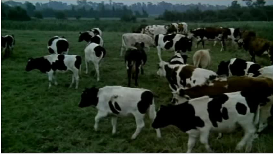
Extrait vidéo 3 : La Horse, 36:52-39:12 © M6 Vidéo.

Quatre déclinaisons du thème reviennent encore : le conciliabule des truands, préparant leur coup du lendemain depuis leur chambre (50:58-51:36), leur face-à-face avec Maroilleur (52:34-53:34), la traque des paparazzis qui accompagne l'enquête menée par les policiers (01:08:28-01:08:43) et le générique de fin. La première occurrence, lors du conciliabule, renforce l'association des trafiquants avec le thème principal ; la musique, toujours aussi énergique, est en contradiction avec l'apparente décontraction des brigands – occupés à laver leur linge ou à se doucher, le chef est allongé sur le lit – laissant supposer que leurs esprits sont préoccupés (« Avec le vieux j'ai pas confiance ! »).