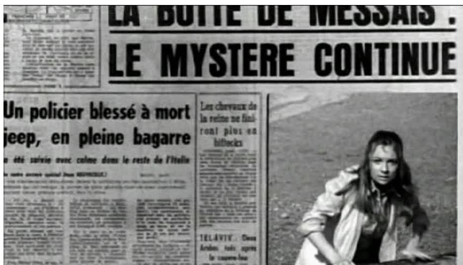
Extrait vidéo 5 : La Horse, 01:08:27-01:08:42 © M6 Vidéo.

Lors de l'occurrence suivante (extrait vidéo 5), l'association du thème principal – symbole de la violence des trafiquants – avec les paparazzis assimile ces derniers aux premiers : comme les trafiquants, les paparazzis viennent en effet de la ville et cherchent à « envahir » la famille Maroilleur en prenant des photos volées 37 . En se servant seulement de la musique pour dénoncer les excès de ce type de photographie, Granier-Deferre démontre la force de l'association musicale au cinéma en l'absence de tout commentaire parlé.