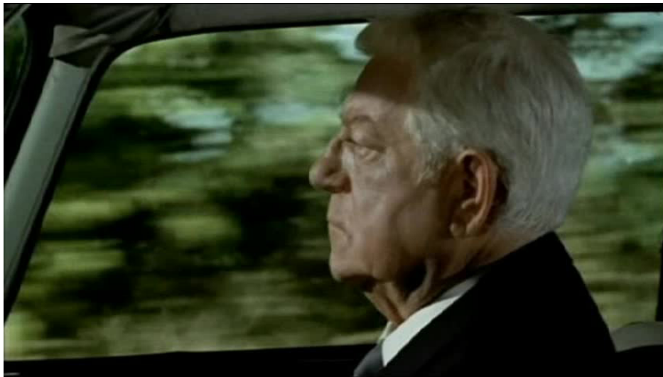
Extrait vidéo 9 : La Horse, 01:14:12-01:16:19

Les entrées musicales suivantes du thème continuent de souligner de manière répétitive le caractère mutique et soudé de la famille derrière le patriarche : on trouve le thème sur un plan d'Auguste taiseux (01:01:13), sur une réplique du même Auguste « J'ai rien à dire » (01:03:29), puis sur une question de son aide Bien-Phu « Quelle grenade ? » (01:04:41) et enfin sur un laconique « À qui le dites-vous ! » (01:10:19) d'Auguste, décidément peu désireux de collaborer avec la police. La dernière occurrence (extrait vidéo 9) tombe à la fin de la remarque du commissaire « Ils sont coriaces ; il y a dix ans, j'ai eu une affaire comme celle-là... des gens de la terre, on a jamais su la vérité » (01:14:06) : le thème accompagne alors le plan des hommes de la famille Maroilleur – Auguste, Henri et le père de celui-ci – qui, tous trois, reviennent du palais de justice dans leur voiture, se regardant sans échanger un mot. L'aspect très distancié du thème met en valeur le côté impersonnel de l'enquête judiciaire, tandis que ses pauses traduisent bien le mutisme des personnages.