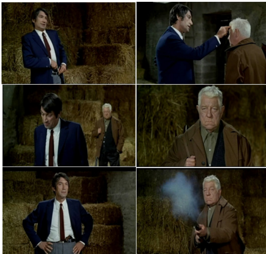
Figure 5 : La Horse, duel entre Maroilleur et Grutti (17:29-18:05) © M6 Vidéo.

La visite de Grutti se termine par un duel : alors qu'il met son revolver à portée de main et commence à provoquer Maroilleur (doigt appuyé sur le front), ce dernier dégaine plus vite que son ombre, plombant le truand de deux coups de chevrotine. Le plan sur le cadavre et la chemise maculée de sang ne sont pas sans évoquer les codes du western spaghetti et du giallo , qui connaissent leurs heures de gloire à la même époque dans le cinéma italien (figure 5). La référence au western sous-tend également les quelques notes de cymbalum dans le thème principal, un instrument que l'on peut entendre par exemple dans le thème de Cheyenne composé par Ennio Morricone pour C'era una volta il West (Sergio Leone, 1968).