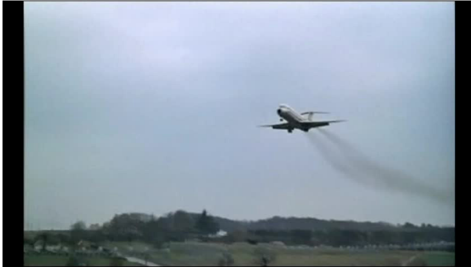
Extrait vidéo 2 : La Horse, 26:14-27:30 © M6 Vidéo.

Sans aller jusqu'à l'alignement dramatique, le décalage dramatique s'atténue (rapprochement progressif vers l'alignement dramatique) au fur et à mesure que le spectateur saisit le lien du thème principal avec le milieu urbain de la drogue. Les deuxième et troisième occurrences ont, quant à elles, rétabli la correspondance cinématique entre les mouvements à l'écran et l'énergie de la musique.