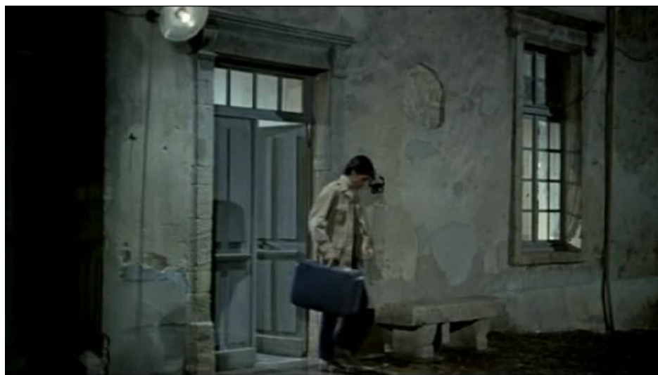
Extrait vidéo 7 : La Horse , 22:52-24:18 © M6 Vidéo.

La première occurrence du thème (extrait vidéo 7) intervient lorsque Maroilleur demande à Henri de « préparer ses affaires » afin de se cacher. Le thème y est alors joué par le piano bastringue, en une vraisemblable allusion à l'atmosphère de western faisant écho au banjo. La présence intermittente du clavecin au sein du thème est un lien sonore avec le thème principal dont l'instrument constitue l'une des sonorités caractéristiques : c'est l'indice que la situation actuelle, quoique niée officiellement par Auguste, est bien le résultat de la visite de Marc Grutti. La disjonction dramatico-cinétique est totale.