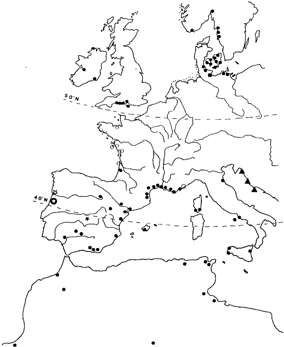
Carte 1 Répartition géographique des taxons de Lamprothamnium en Europe occidentale :

Map 1 Geographical distribution of the taxa of Lamprothamnium in Western Europe : L. Aragonense , ☆ ; L. Carrissoi , ⊙ ; L. hansenii , ◼ ; L. mediterraneum , ▲ ; L. papulosum , ● ; L. toletanum , ☆ ; localités disparues, V.