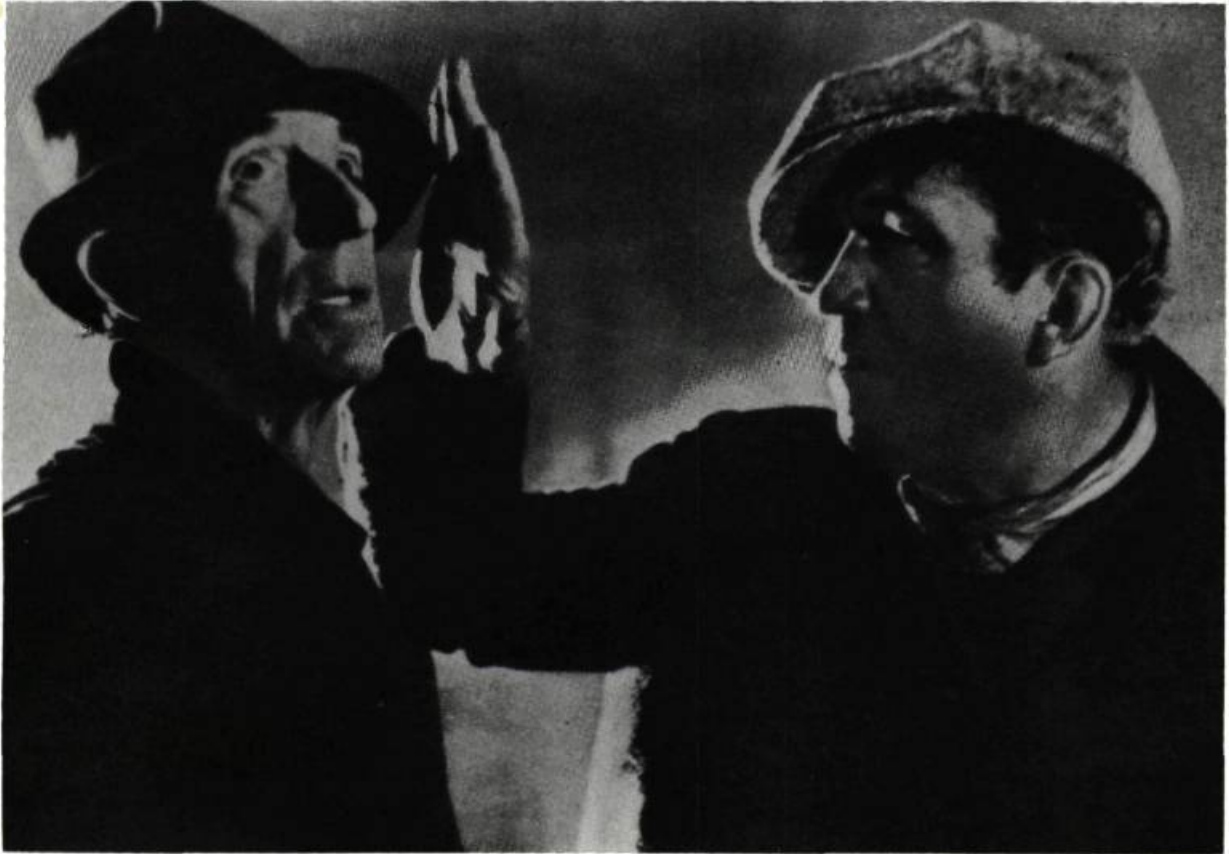
Le mouchard , de John Ford

veau cinéma (la chanson de Préjean) servent des effets visuels. Julien Duvivier, avec David Golder (1930), utilise le son pour créer l'atmosphère. Jacques Feyder, avec Le Grand Jeu (1932), dédouble son héroïne par le simple jeu des voix.