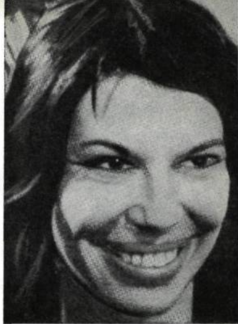
Le cinéma-vérité en France, Chronique d'un été de Jean Rouch

Le cinéma-vérité ne remplacera pas le cinéma conventionnel. La fiction continuera d'offrir l'humus le plus fertile du cinéma. Elle obtiendra toujours les suffrages du public. Pour un film ... Pour la Suite du monde , il faudrait au cinéma canadien plusieurs longs métrages fidèles à la tradition cinématographique contemporaine. Notre cinéma consacre trop de son temps et de ses efforts au cinéma-vérité. ... Pour la Suite du monde , oui! D'accord et mille fois bravo! Mais... à quand le cinéma canadien tout court?